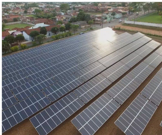
Figura 1 – Imagem Placa Solar

Energia fotovoltaica é a energia elétrica produzida a partir de luz solar. Os painéis solares fotovoltaicos são dispositivos utilizados para converter a energia da luz do Sol em energia elétrica, eles são compostos por células solares, assim designadas, já que captam, em geral, a luz do Sol. Conforme ilustrada na Figura 1.