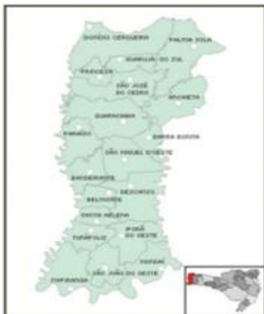
FIGURA 1: Microrregião de São Miguel do Oeste

Apesar do aparente crescimento urbano das cidades, ainda a dependência fortemente ligada ao setor primário - a agricultura - Dados de 1991 (IBGE, 1991) mostram como esta região é marcada por pequenos agricultores, onde 75,19% das fazendas têm entre dez e vinte hectares, favorecendo a ocupação de uma força de trabalho regional nas áreas rurais. No entanto, a partir de 1990, com a modernização dos meios agrícolas, e a diminuição da mão de obra, as pessoas, saíram do meio rural, para buscar melhores condições de vida e trabalho em serviços e indústrias.