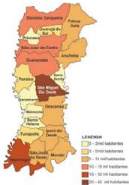
População do extremo Oeste