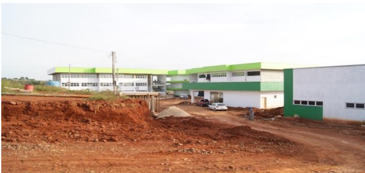
FIGURA 2 - Construção 2011

A construção do Campus iniciou em 2008, juntamente com a expansão do instituto por outras cidades de Santa Catarina, como um apelo à época, do crescimento do ensino técnico e profissionalizante em todo o país uma obra que evidenciou ainda mais o destaque de São Miguel do Oeste, como polo de desenvolvimento da microrregião extremo oeste.