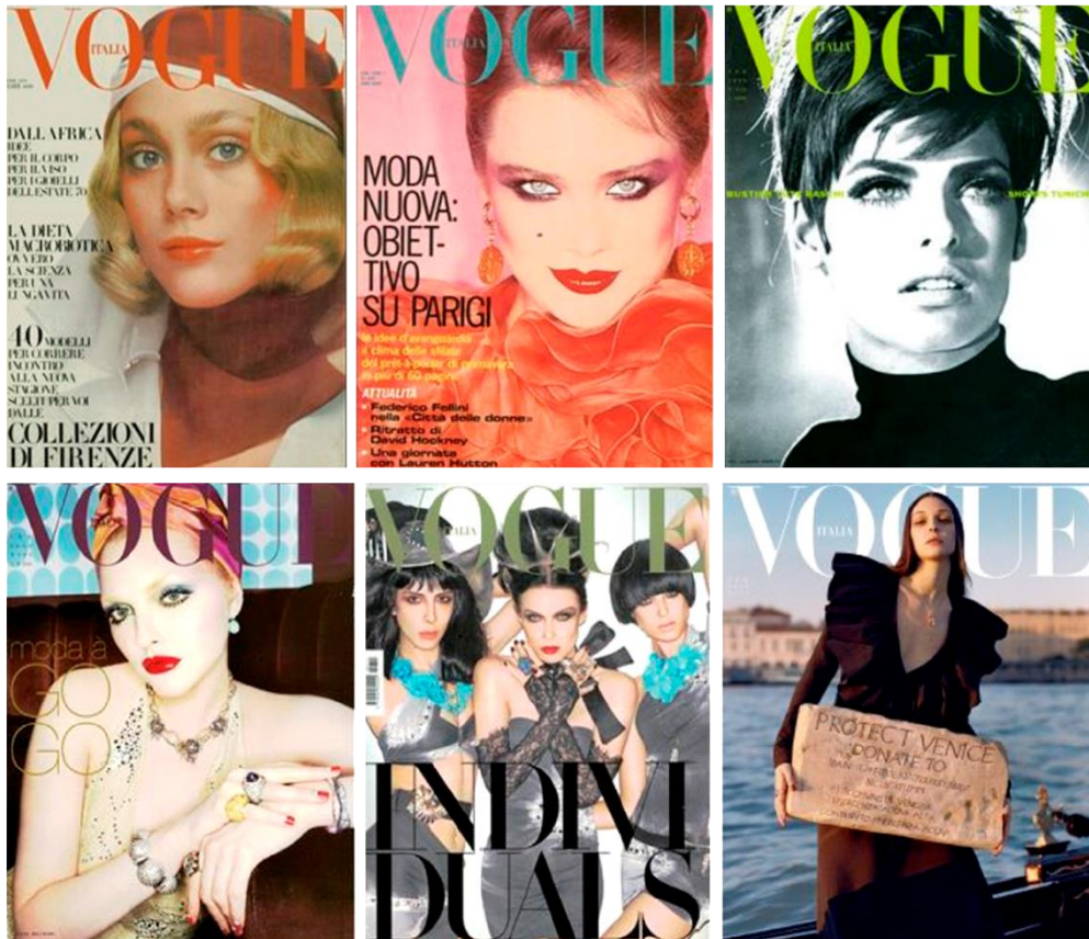
Figura 02: Revistas Vogue Itália, edição de fevereiro a cada década. Da esquerda para a direita: Fevereiro de 1970, fevereiro de 1980, fevereiro de 1990, fevereiro de 2000, fevereiro de 2010 e fevereiro de 2020