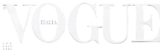
Figura 03: Vogue Itália, edição de abril de 2020

A revista Vogue Itália, em sua edição de abril 2020, pela primeira vez na história da revista estampou uma capa branca, como visto na figura 03. A capa foi feita dessa forma por conta da pandemia que se alastrou pelo mundo, em decorrência da COVID-19. Segundo 3 Emanuele Farneti, editor chefe da revista Vogue Itália, em um comunicado: “[...] a decisão de imprimir uma capa completamente branca pela primeira vez em nossa história. Não porque houvesse falta de imagens - muito pelo contrário. Mas porque branco significa muitas coisas ao mesmo tempo”. Essa edição da revista Vogue pode ser um exemplo de uma imagem que encarna, sem a necessidade de uma imagem propriamente dita, sendo capaz de transmitir diversos pensamentos. “A imagem da carne, isto é, carnação e visibilidade, a uma ausência, mediante uma diferença intransponível relativamente àquilo que é designado” (MONDZAIN, 2009, p. 26).