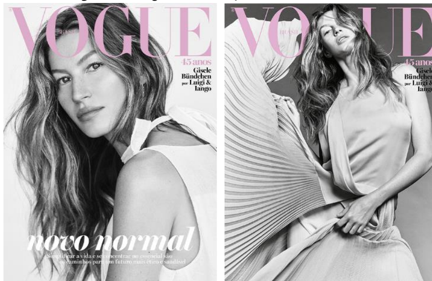
Figura 04: Vogue Brasil, edição de maio de 2020

Trazer uma mensagem tão significativa quanto a que está na revista Vogue Itália não é uma tarefa fácil, ela necessita de sensibilidade em sua produção, a sensibilidade que falta em alguns criadores, como foi o caso da Vogue Brasil, em sua edição de maio de 2020. A Vogue Brasil estampou em sua capa Gisele Bündchen em uma imagem preto e branco com os dizeres “Novo normal”, como podemos observar na figura 04.