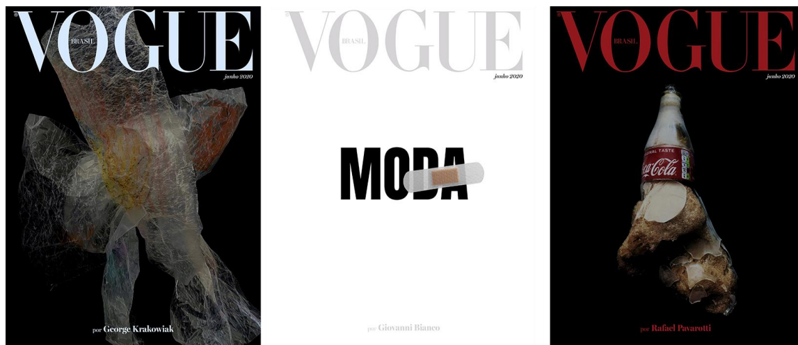
Figura 07: Capas Digitais da edição de junho

Notamos que essas edições anteriores à de maio são imagens nas quais a Vogue estava acostumada a trabalhar, imagens produzidas e reproduzidas diversas vezes com a figura da modelo e artista que se encaixa em padrões. O consumo dessa imagem é rápido, e logo a esquecemos, conforme pontuaram Adorno e Horkheimer (1985). Após o “Novo Normal”, sua sucessora foi uma homenagem à capa do álbum “Paratodos”, de Chico Buarque, com o título “A união faz a força na moda nacional”. A revista buscou criar uma ponte e promover o diálogo entre toda a cadeia da moda e, além de trazer sua capa principal, a edição também contou com vinte capas digitais. Cada capa foi produzida por um representante diferente da cadeia da moda brasileira. Essas capas trouxeram diferentes debates, os quais incluíam: a quebra de padrões, consumo consciente e diversidade. Seguem abaixo, na figura 07, três das vinte capas produzidas.