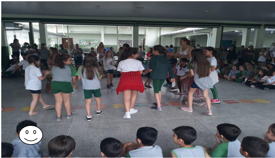
Figura 8 - Interação de turmas no recreio.