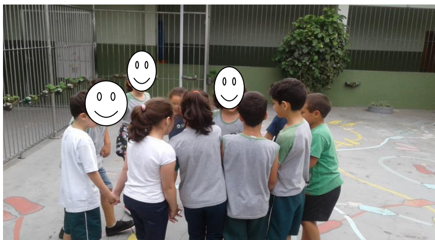
Figura 7 – Educandos demonstrando autonomia.

Estes momentos demonstram a autonomia dos educandos como afirma Freire em seus estudos, conforme figura 7.