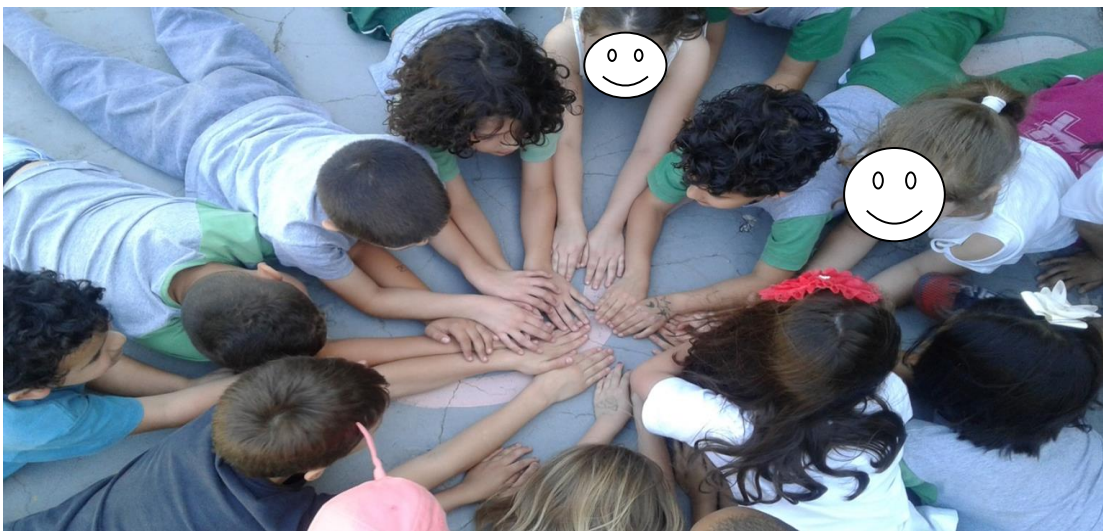
Figura 9 - Um dos momentos de interação da turma.

A dança em roda demonstrou que, na prática, desenvolveu a percepção corporal e a interação social dos educandos e foi possível perceber a mudança comportamental na turma de forma geral, contribuindo para harmonia do grupo e para a aprendizagem, conforme figura 9.