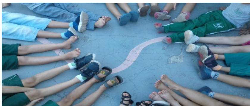
Figura 5 – Atividade com educandos.

Momentos de atividades de percepção corporal, e lateralidade, conforme figura 5.