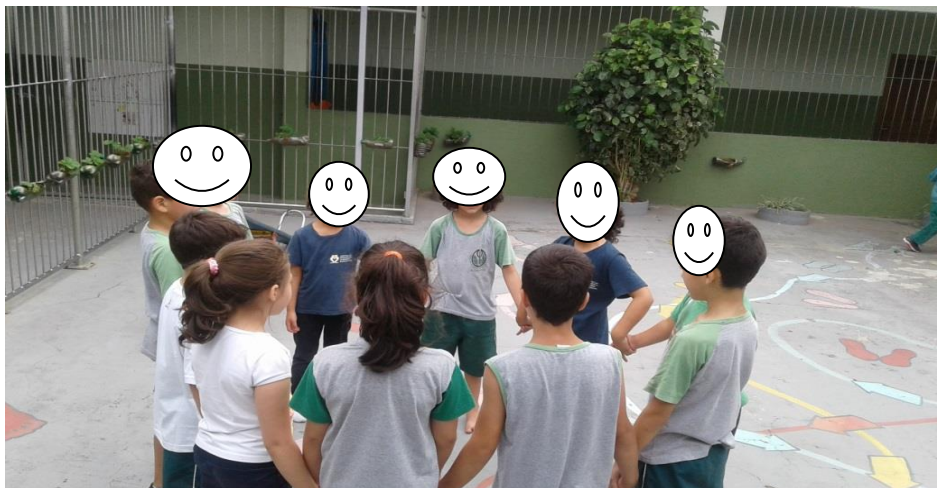
Figura 6 – Educandos se organizando para dança de roda.

Momento onde mostra a interação entre os educandos se organizando para realizar a dança de roda no parque, conforme figura 6.