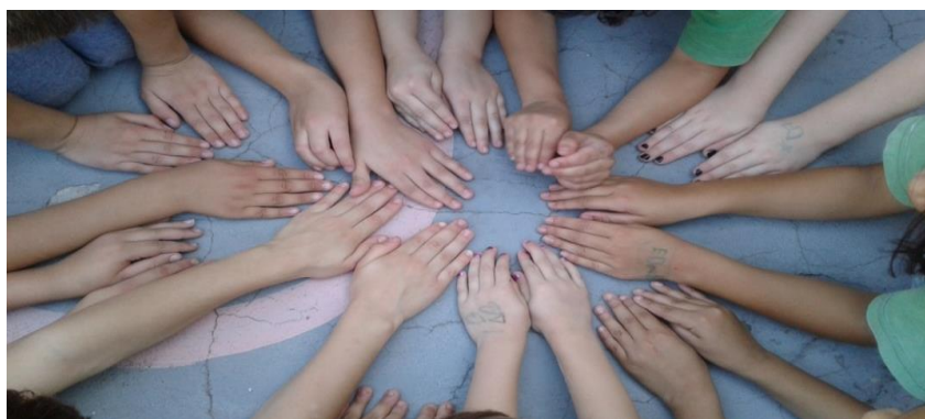
Figura 4 – Educandos em momento de interação.

Realizou-se vários momentos lúdicos para promover a interação, conforme figura 4.