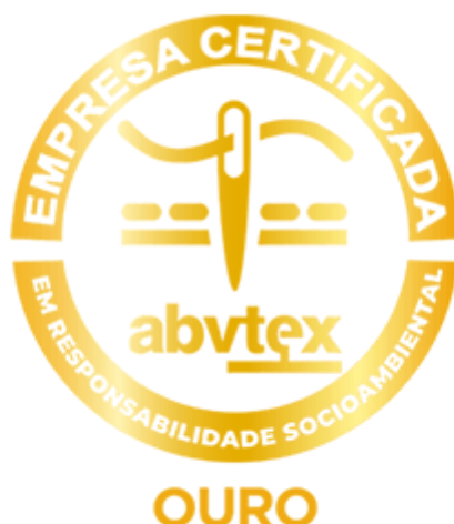
Figura 3: Selo ouro