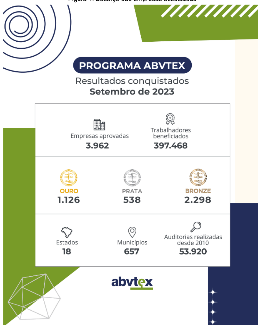
Figura 4: Balanço das empresas associadas

No último boletim emitido pelo site da ABVTEX em março de 2023, é destaque o número de associadas que já possuem o selo ouro do programa, das 3.924 empresas que possuem o selo, 1.031 são ouro, um recorde para o programa. (ABVTEX, 2023). Na figura 4 é possível conferir o balanço das associadas dentro do programa.