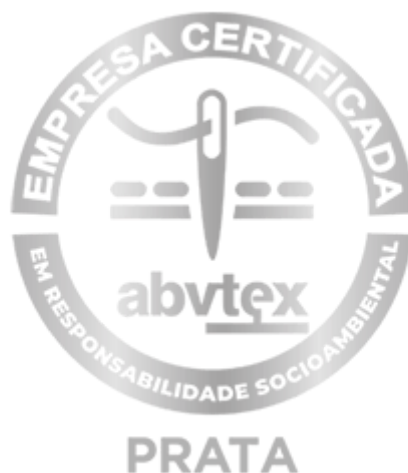
Figura 2: Selo prata