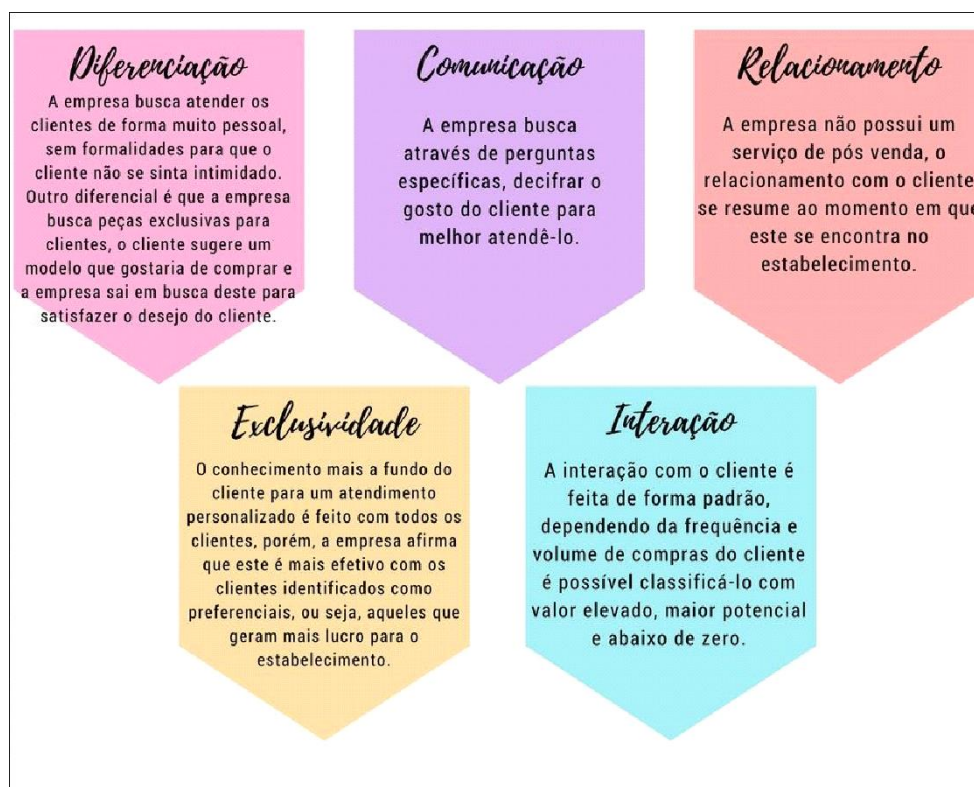
Figura 4 - Análise dos dados coletados