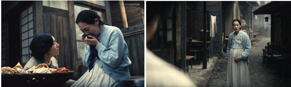
Figura 6 - Cenas do episódio cinco. A) Sunja e cunhada. B) Sunja negociando com cobradores japoneses.