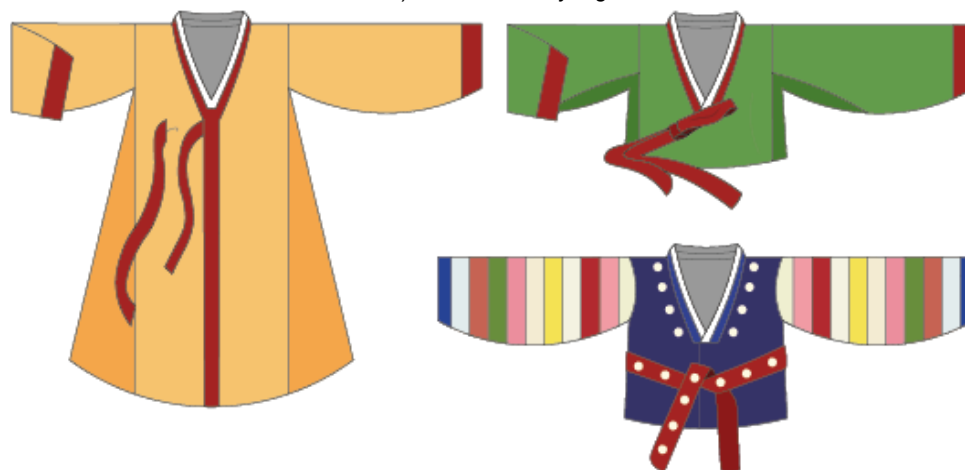
Figura 3: Desenhos elaborados pelo autor. A) durumagi (esquerda). B) Jeogori (direita acima). C) Jeogori (direita abaixo) da classe alta yangban .

Fontes: Adaptado de Doopedia (s/d.); Shim (2001 p. 79-80) e Kyung Ja; Jung (2013 p. 19)