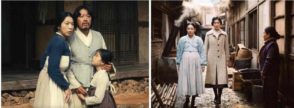
Figura 1: Fases de Sunja. A) Sunja e família na fase um. B) Sunja e cunhada na fase dois.