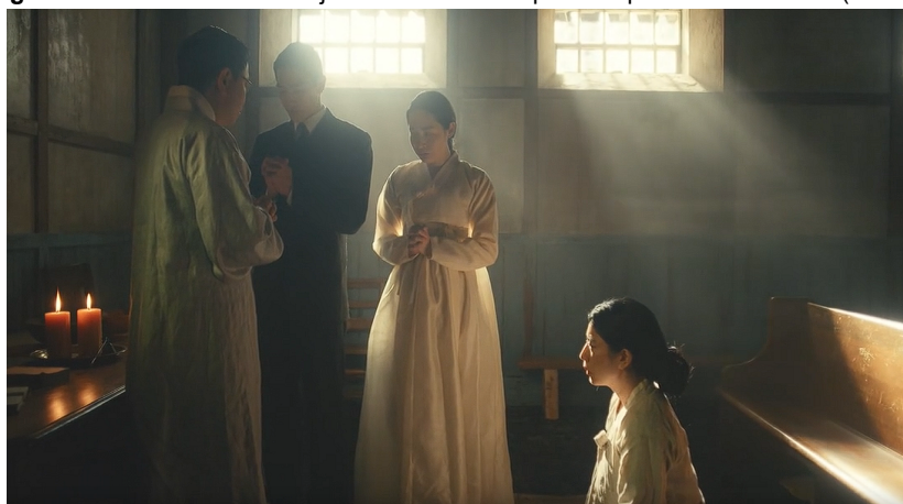
Figura 5 - Casamento de Sunja e Baek Isak no episódio quatro de Pachinko (2021)