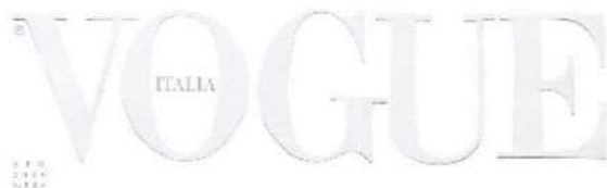
Figura 03: Vogue Itália, edição de abril de 2020

A revista Vogue Itália, em sua edição de abril 2020, pela primeira vez na história da revista estampou uma capa branca, como visto na figura 03. A capa foi feita dessa forma por conta da pandemia que se alastrou pelo mundo, em decorrência da COVID-19. Segundo 3 Emanuele Farneti, editor chefe da revista Vogue Itália, em um comunicado: “[...] a decisão de imprimir uma capa completamente branca pela primeira vez em nossa história. Não porque houvesse falta de imagens - muito pelo contrário. Mas porque branco significa muitas coisas ao mesmo tempo”. Essa edição da revista Vogue pode ser um exemplo de uma imagem que encarna, sem a necessidade de uma imagem propriamente dita, sendo capaz de transmitir diversos pensamentos. “A imagem da carne, isto é, carnação e visibilidade, a uma ausência, mediante uma diferença intransponível relativamente àquilo que é designado” (MONDZAIN, 2009, p. 26).