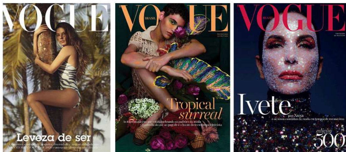
Figura 07: Da esquerda para a direita: edição de janeiro, fevereiro e abril de 2020

Logo acima, citamos o desatino publicado pela Vogue Brasil sobre o “Novo Normal” e como isso poderia ser consequência da crítica positiva que a Vogue Itália recebeu e que expandiu a discussão sobre o que em outros tempos poderia ter passado despercebido. Entretanto, devido aos acontecimentos correntes de uma pandemia, o público que consome moda está mudando, assim como as imagens de moda também precisam acompanhar essas mudanças. O debate que ocorreu sobre o “Novo Normal” fez com que a vogue repensasse a forma com que a imagem é mostrada na revista. Para fazermos o comparativo sobre como esta discussão foi importante, mostraremos as três edições anteriores à de maio e a edição (Figura 07) seguida à revista de maio.