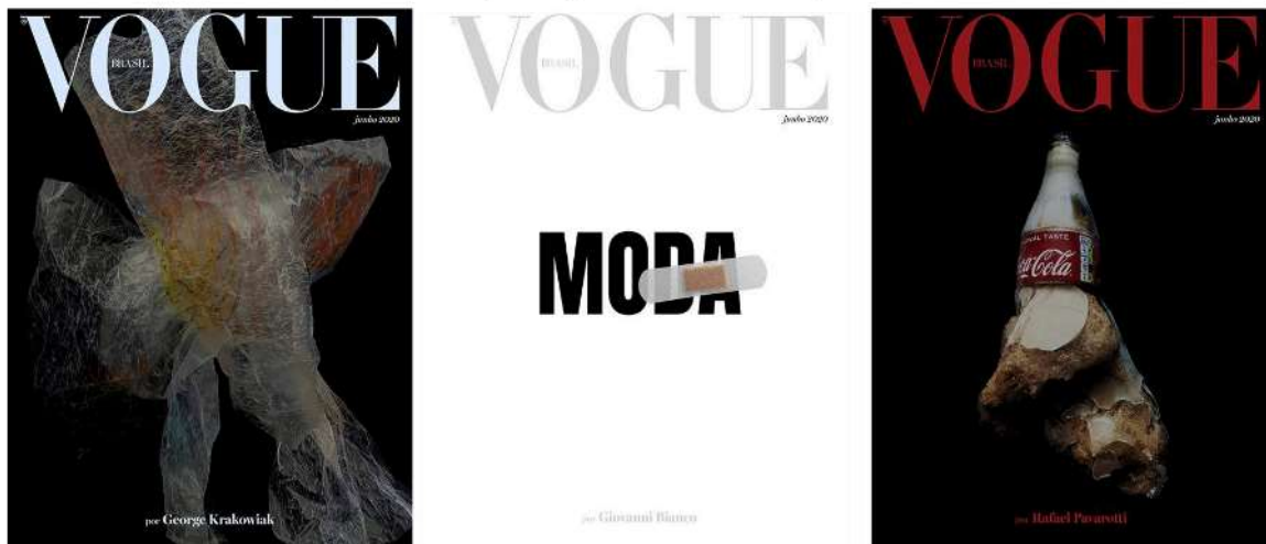
Figura 07: Capas Digitais da edição de junho

Notamos que essas edições anteriores à de maio são imagens nas quais a Vogue estava acostumada a trabalhar, imagens produzidas e reproduzidas diversas vezes com a figura da modelo e artista que se encaixa em padrões. O consumo dessa imagem é rápido, e logo a esquecemos, conforme pontuaram Adorno e Horkheimer (1985). Após o "Novo Normal", sua sucessora foi uma homenagem à capa do álbum "Paratodos", de Chico Buarque, com o título "A união faz a força na moda nacional". A revista buscou criar uma ponte e promover o diálogo entre toda a cadeia da moda e, além de trazer sua capa principal, a edição também contou com vinte capas digitais. Cada capa foi produzida por um representante diferente da cadeia da moda brasileira. Essas capas trouxeram diferentes debates, os quais incluíam: a quebra de padrões, consumo consciente e diversidade. Seguem abaixo, na figura 07, três das vinte capas produzidas.