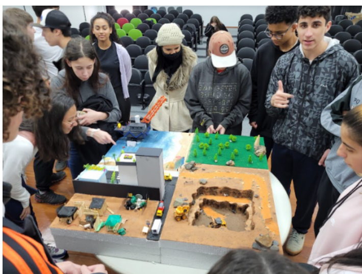
Figura 3 - Interação e interpretação da maquete.

Na terceira atividade elaborada, era solicitado aos estudantes que observassem uma maquete (construída pelos membros do projeto, apresentada na Figura 3) que representava os impactos socioambientais da produção e do descarte de equipamentos eletrônicos. A partir dessa observação, os estudantes deveriam relatar o que interpretavam de cada uma das áreas representadas na maquete (a saber: extração mineral, vegetação nativa, plataforma petrolífera, condomínios de luxo e favela).