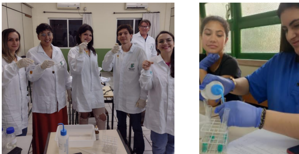
Figura 4 - Atividade experimental de identificação de metais nas PCE.