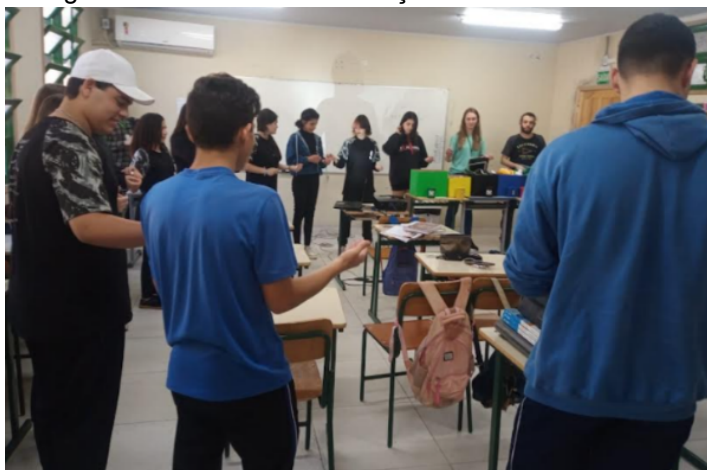
Figura 2 - Dinâmica de simulação da corrente elétrica.

Neste sentido, acredita-se que a realização da atividade de simulação da corrente elétrica tenha possibilitado uma aprendizagem mais envolvente e atuado como ferramenta auxiliar na mediação dos conceitos científicos, facilitando a compreensão por parte dos estudantes. Além disso, a dinâmica favoreceu uma relação mais interativa e participativa entre estudantes e professores.