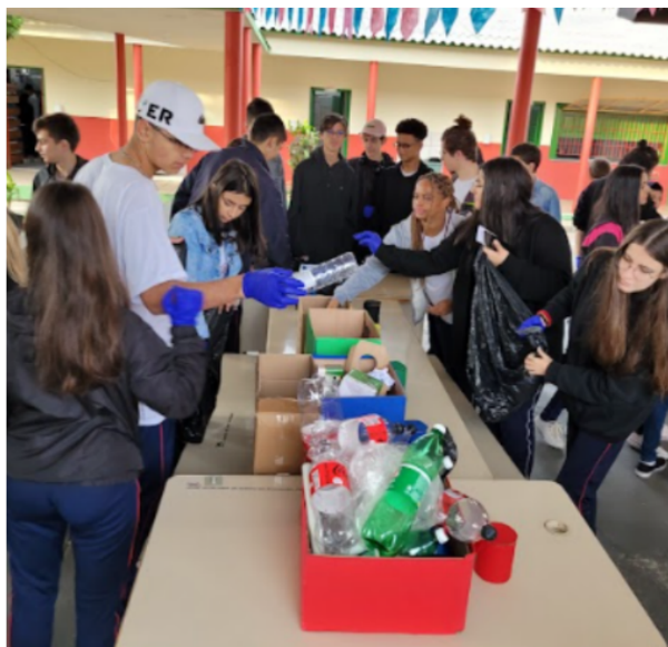
Figura 1 - Dinâmica da “Caça ao Lixo”.