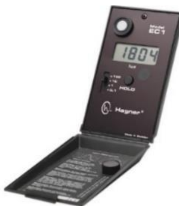
Figura 4 - Luxímetro digital modelo EC1.

Para as aferições, utilizou-se um luxímetro calibrado com as correções necessárias especificada pelo fabricante. O modelo utilizado foi o EC1 da marca Hagner, que realiza medidas de iluminação no ambiente nas faixas de 0,1-200.000 lux, representado na Figura 4 abaixo: