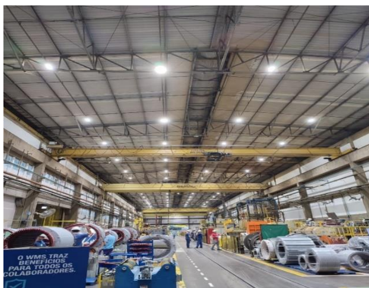
Figura 1 – Sala de Bobinagem de uma fábrica da área metal mecânica.

O estudo foi desenvolvido em um setor de uma empresa metal mecânica do norte catarinense, no período de outubro a novembro de 2023. O setor de bobinagem (Figura 1) foi selecionado por apresentar fluxo contínuo de produção.