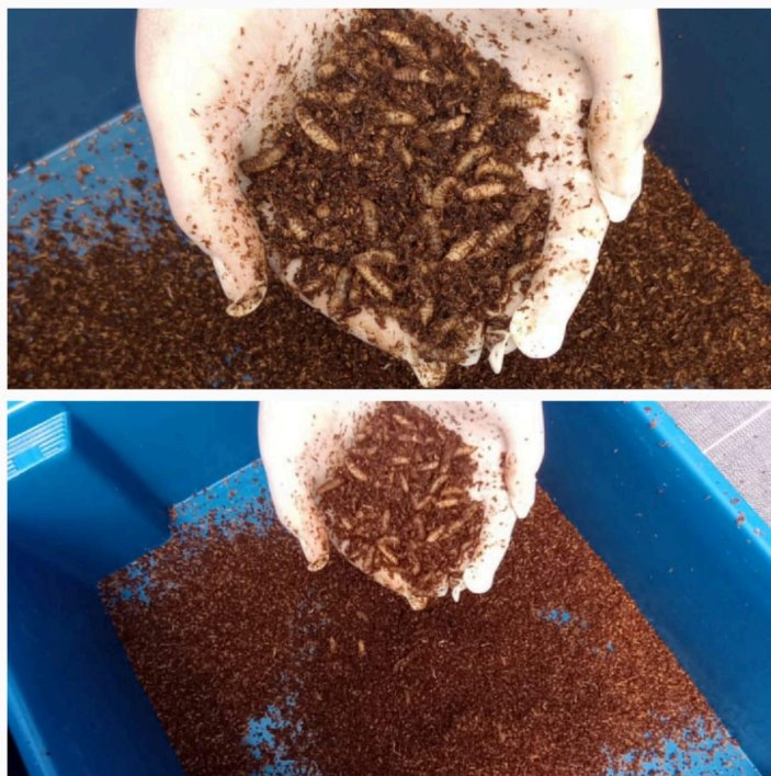
Figura 2 - Larvas de Mosca Soldado Negro produzindo FRASS