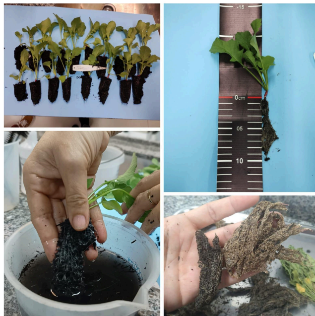
Figura 4 - Comprimento de raiz, largura e comprimento de folha e altura de parte aérea

Para os valores de comprimento de raiz, largura e comprimento de folha e altura de parte aérea, foi utilizada uma fita graduada em centímetros e os indivíduos, após toilet , foram mensurados (Figura 4).