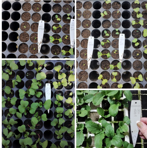
Figura 3 - Germinação, emergência dos cotilédones e abertura das folhas verdadeiras.