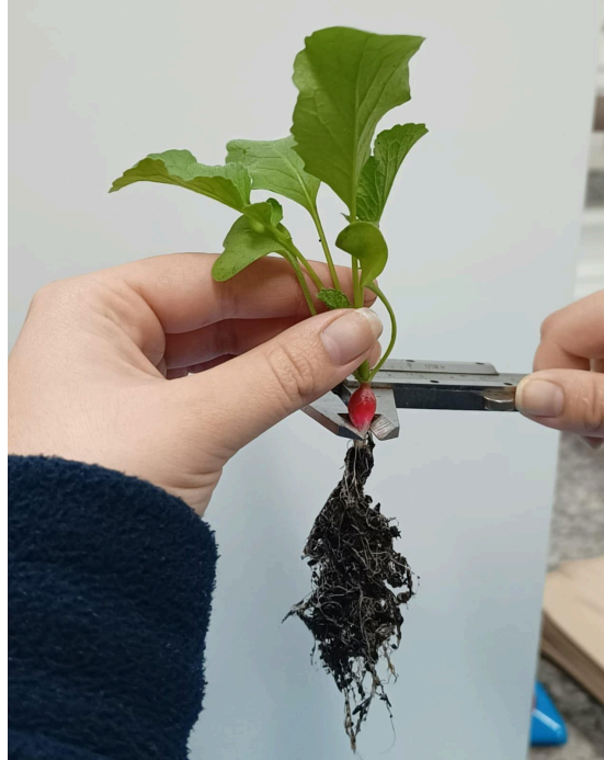
Figura 5 - Diâmetro do colo das plantas.