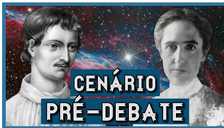
Figura 1 - Thumbnail do primeiro vídeo