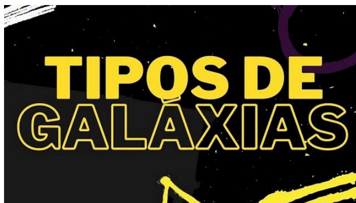
Figura 4 - Thumbnail do quarto vídeo