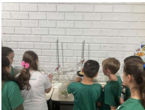
Imagem 7

O pôster foi feito com gráficos e imagens ilustrativas (Imagem 9). Além disso, os alunos prepararam explicações claras para acompanhar cada seção do estande, tornando o projeto acessível aos visitantes.