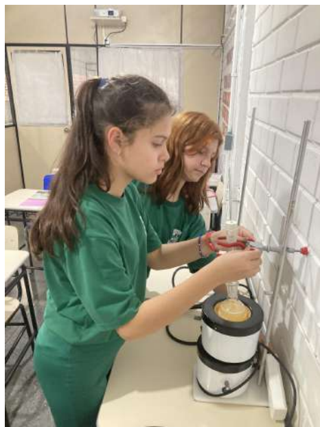
Imagem 5

de um sistema de circulação e resfriamento de água, gotejando em um segundo recipiente.