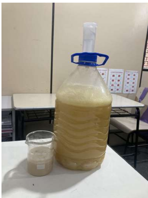
Imagem 3 - Fonte Clube de Ciências, 2024.