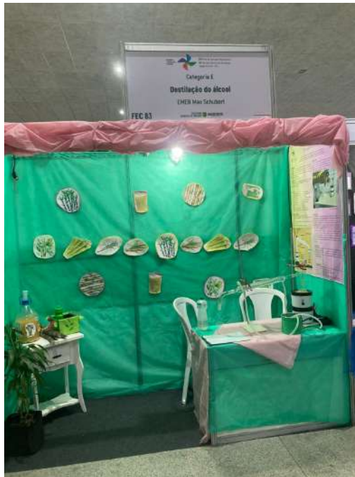
Imagem 10 - Fonte: Clube de Ciências, 2024.