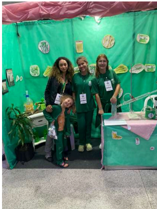
Imagem 11 - Fonte: Clube de Ciências, 2024.