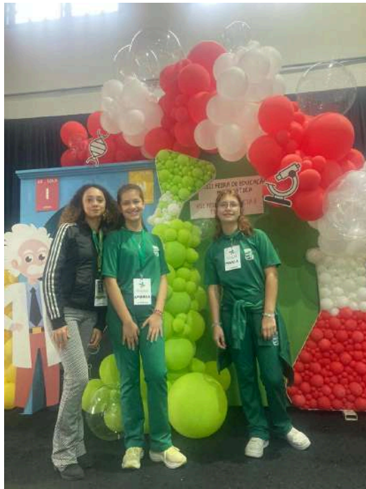
Imagem 12 - Fonte: Clube de Ciências, 2024.