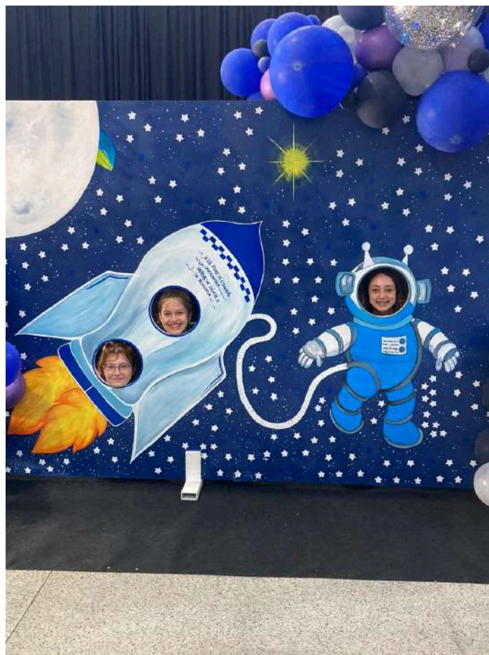
Imagem 13