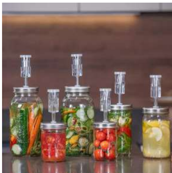
Imagem 2

Esse tipo de tampa é projetado para permitir que o gás carbônico gerado durante o processo de fermentação escape do galão sem que o oxigênio entre. Ela funciona por meio de uma válvula unidirecional ou um tubo submerso em água. Quando o gás carbônico se acumula dentro do galão, ele empurra a água para fora do tubo, liberando o gás. A água age como uma barreira física, impedindo que o oxigênio entre, criando um ambiente fechado e anaeróbico necessário para a fermentação.