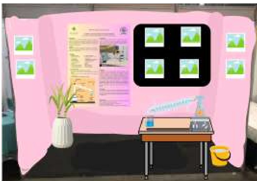
Imagem 9 - Fonte: Clube de Ciências, 2024.

Na 6ª semana, as alunas que iriam participar da Feira de Ciências foram preparadas na escola para a apresentação do projeto. Durante esse período, elas passaram a se gravar várias vezes com o Chromebook, prática que teve como objetivo aprimorar suas habilidades de comunicação e garantir que estivessem prontas para apresentar de forma clara e objetiva.