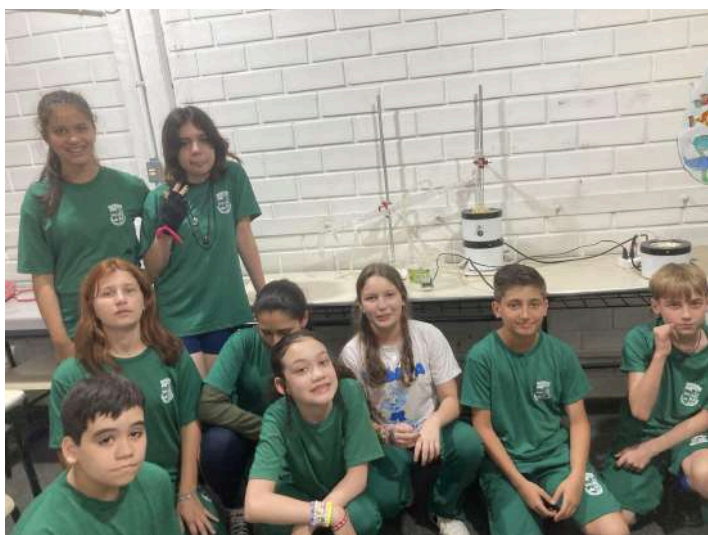
Imagem 8