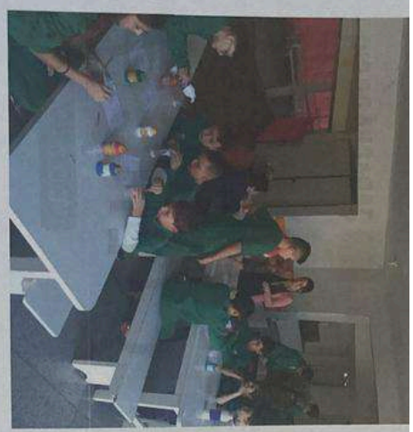
Clube de Ciências, 2021.