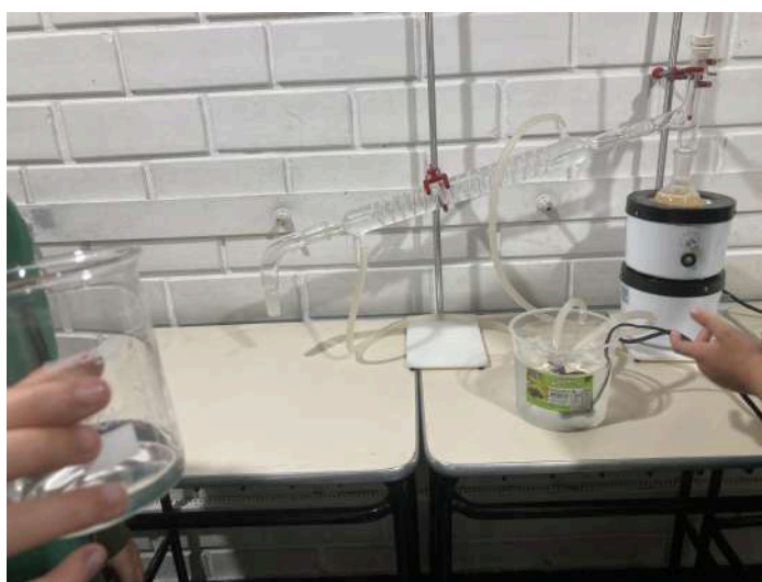
Imagem 6 - Fonte: Clube de Ciências, 2024.

Os alunos observaram o processo de condensação e coleta do etanol. Para o funcionamento do experimento foi utilizada uma bomba de aquário para reaproveitamento da água que circula no sistema.