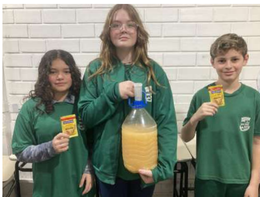
Imagem 4 - Fonte Clube de Ciências, 2024.

Dando continuidade às etapas do projeto, foi realizada a montagem do equipamento de destilação (Imagem 5), revisando os princípios teóricos e explicando que o etanol tem um ponto de ebulição mais baixo que a água, permitindo sua separação durante o processo de destilação. O equipamento foi cuidadosamente preparado no laboratório com a participação dos alunos, consolidando seu entendimento.