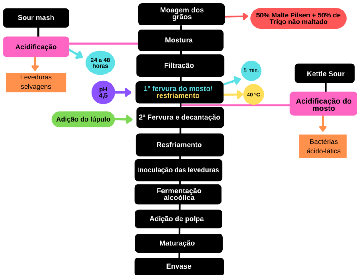
Figura 2 - Fluxograma de processo de produção da cerveja Catharina Sour.