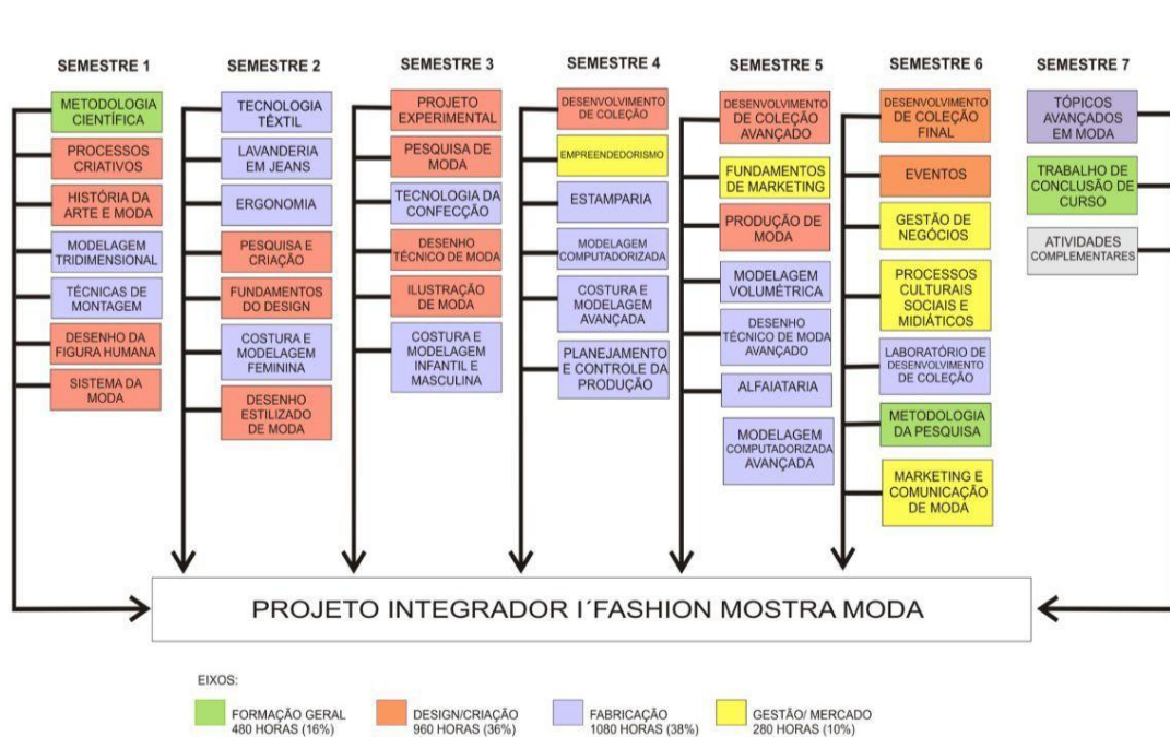
Imagem 2: Matriz Curricular IFSC