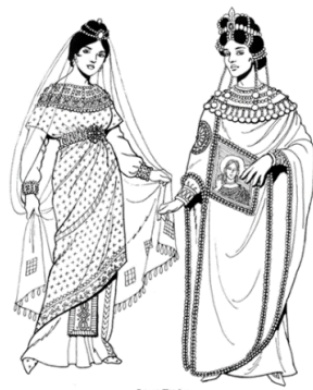
Figura 3 - Ornamento aplicado em tecido simultaneamente.