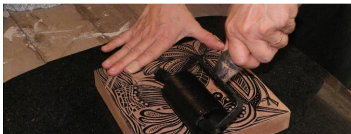
Figura 1- Xilogravura em madeira/carimbo