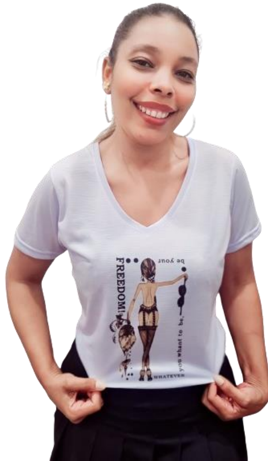
Figura 8 – Fotografia com amostra física e estampa aplicada na peça.