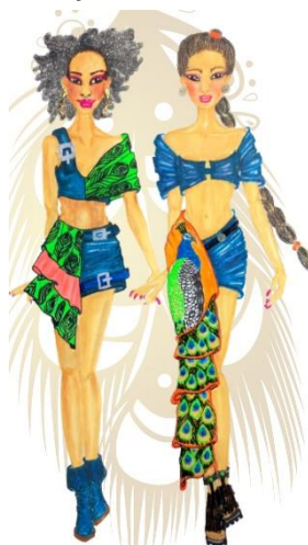
Figura 2 - Ilustração de Moda - Coleção final

Para tal demonstração deste processo de ilustração de moda com estampa contextualizada na peça como estética visual do produto, agrega-se ao trabalho presente uma imagem abaixo autoral de coleção final de conclusão de curso Design de Moda.