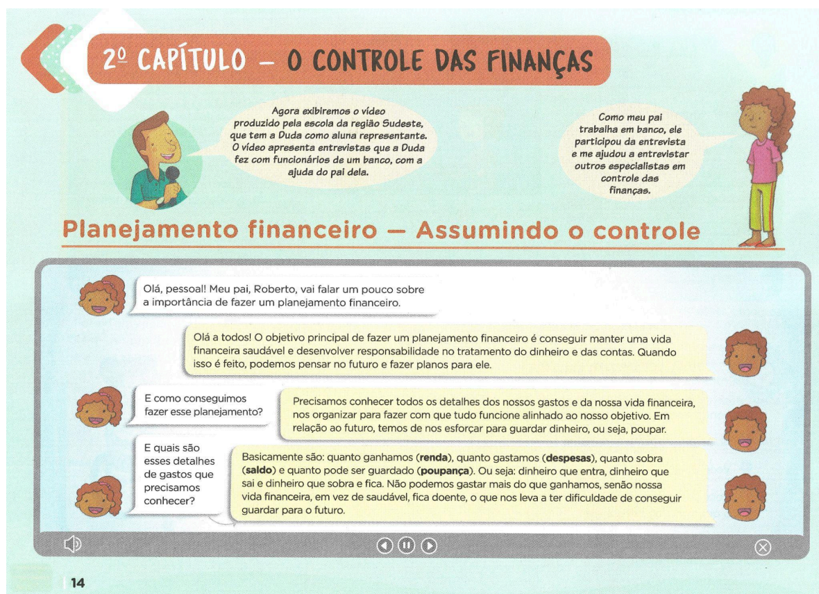
Figura 2 - Exemplificando a introdução dos capítulos com a imagem do capítulo 2.