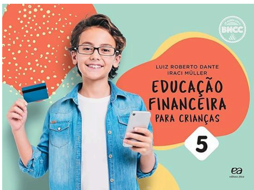
Figura 1 - Capa do livro em questão.