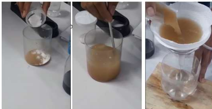
Figura 4 - Separação por dissolução fracionada