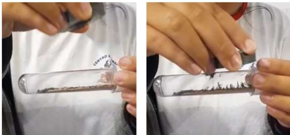
Figura 3 - Separação magnética