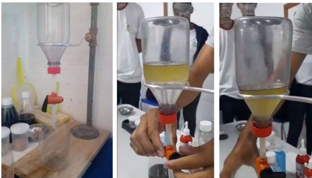
Figura 3 - Experimento de decantação