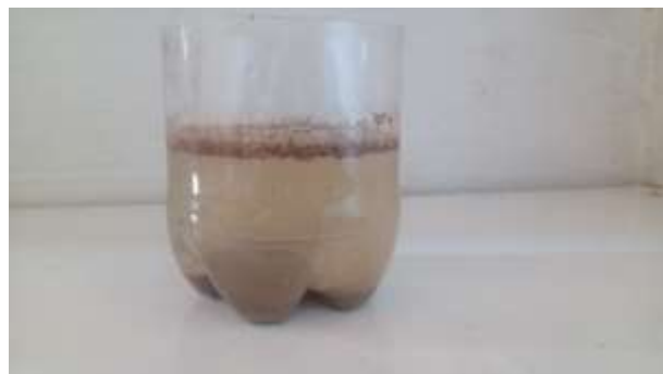
Figura 2 - Experimento por flotação

Copo transparente – reaproveitado Água – casa Areia – casa Serragem