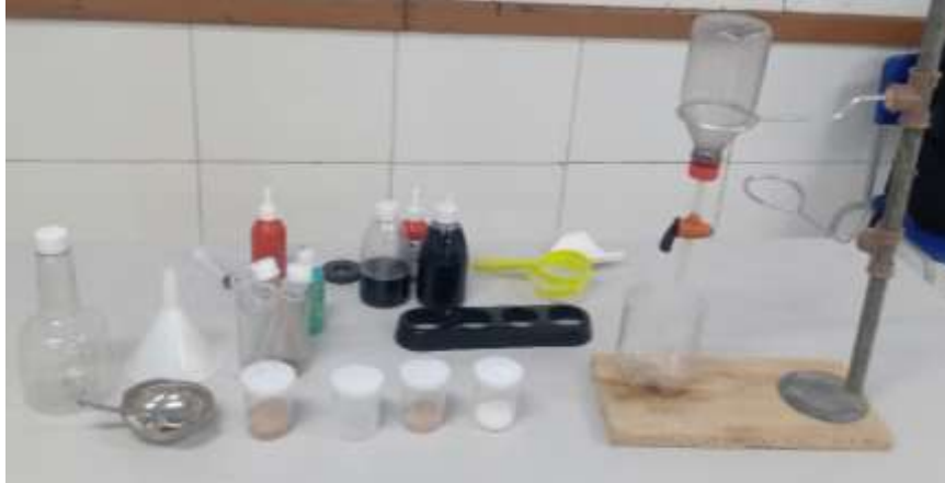
Figura 2 - Materiais comprados e confeccionados