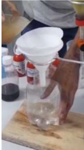
Figura 1 - Experimento filtração

Copo transparente – reaproveitado Suporte universal – confeccionado Água – casa Areia – casa Funil – casa Guardanapo – casa