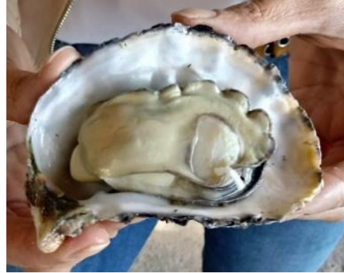
Figura 1B - Crassostrea gigas (Ostra-do-pacífico)