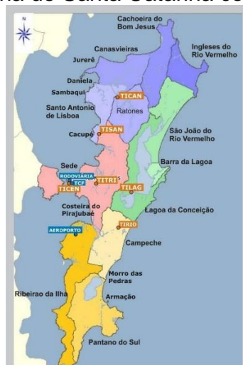
Figura 2 - Mapa da Ilha de Santa Catarina com divisão dos Distritos

A cidade de Florianópolis possui 26 bairros instituídos oficialmente por Lei, segundo a Superintendência de Planejamento e Gestão Territorial, da Prefeitura Municipal (2024). O Distrito do Ribeirão da Ilha, encontra-se a cerca de 22 quilômetros do Centro da cidade e abrange 10 bairros, possuindo cerca de 51,54 km 2 que se estendem desde a foz do Rio Tavares, na divisa com o bairro Costeira do Pirajubaé, até a Praia de Naufragados, no extremo sul da Ilha. Na figura 2, é possível identificar a divisão da Ilha de Santa Catarina em seus respectivos distritos: