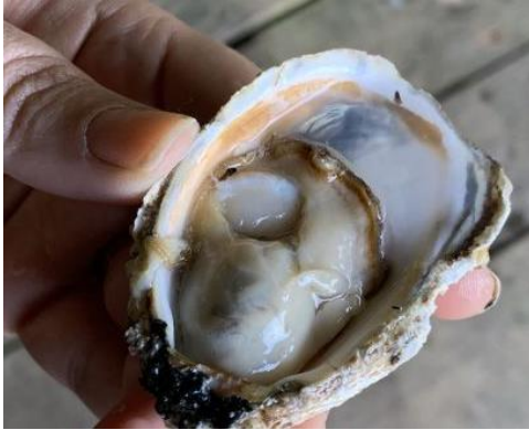
Figura 1A - Crassostrea rhizophorae (Ostra nativa)