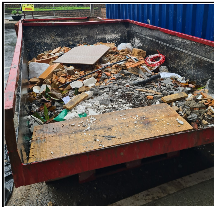
Figura 1: Caçamba para coleta de RCC em obra no município de Criciúma, SC

Neste contexto, infere-se que medidas para redução dos resíduos gerados no canteiro de obras com metragem inferior a 150 m 2 nem sempre ou até raramente são adotadas. Nas obras acima de 150 m 2 , embora a legislação estabeleça a necessidade de um PGRS, observações prévias indicaram que o principal objetivo da sua elaboração tem sido, principalmente, atender minimamente a legislação e evitar as sanções ambientais, mas sem vislumbrar a possível reutilização ou reciclagem destes resíduos.