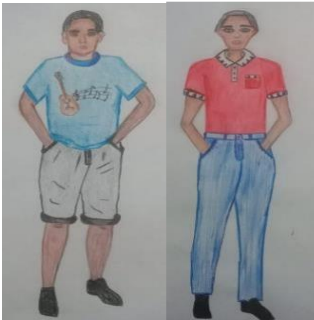
Figura3.Shirt masculina estampa frontal. Figura 4. Camisa gola polo.

Desenho de croqui, baseado em relatos de pessoas com deficiência visual e baixa visão.