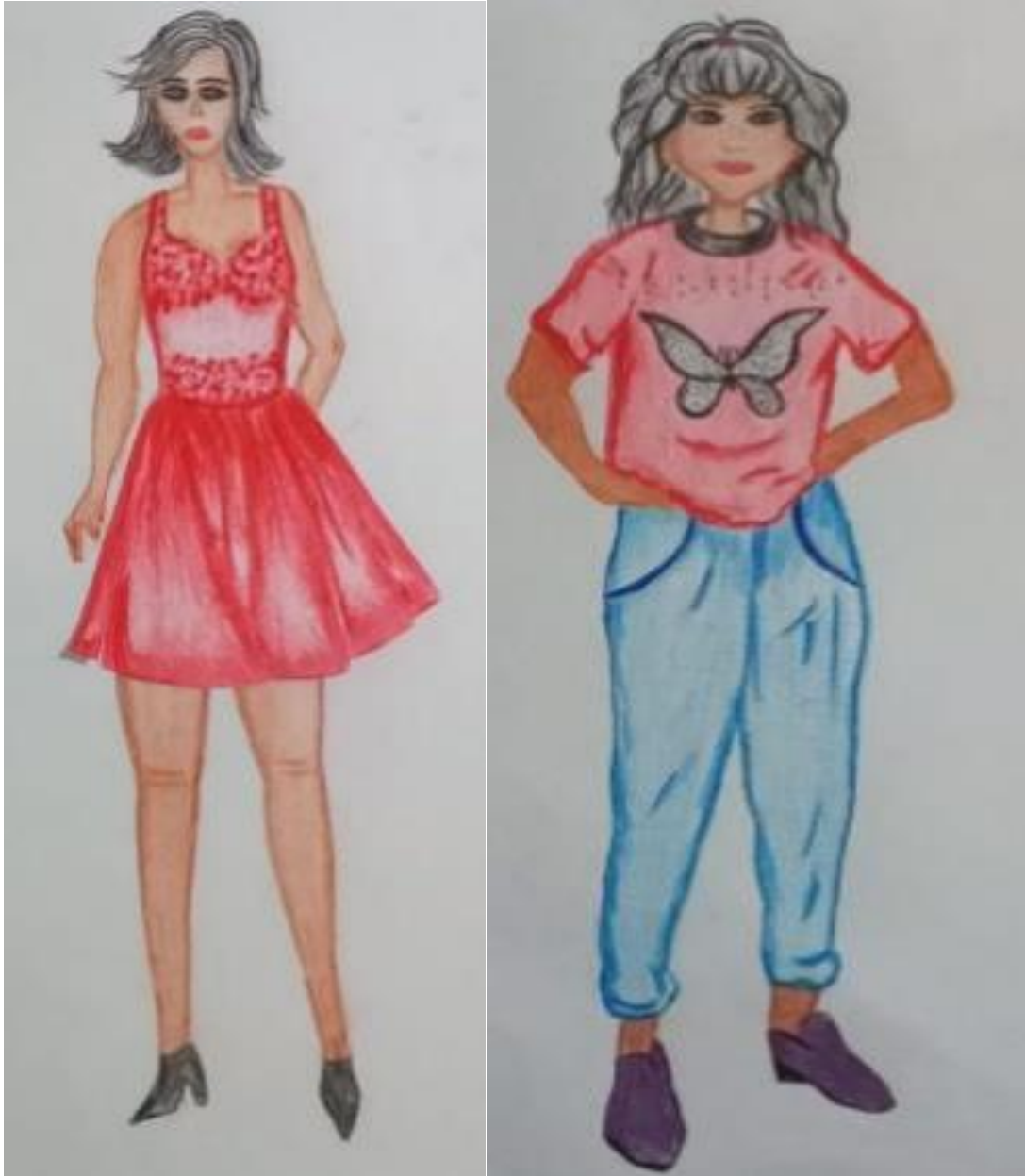
Figura 1. Vestido decote coração. Figura 2. T-Shirt com bordado lantejola.

Desenho de croqui, baseado em relatos de pessoas com deficiência visual e baixa visão.