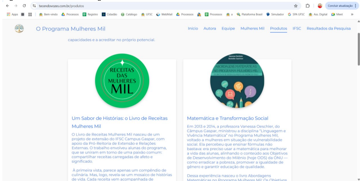
Figura 3 – Produtos do Programa Mulheres Mil