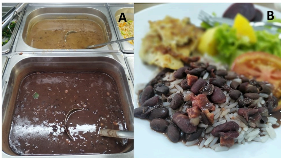
Figura 1. Feijões da espécie Phaseolus vulgaris em bufê de restaurante econômico em Florianópolis (SC)