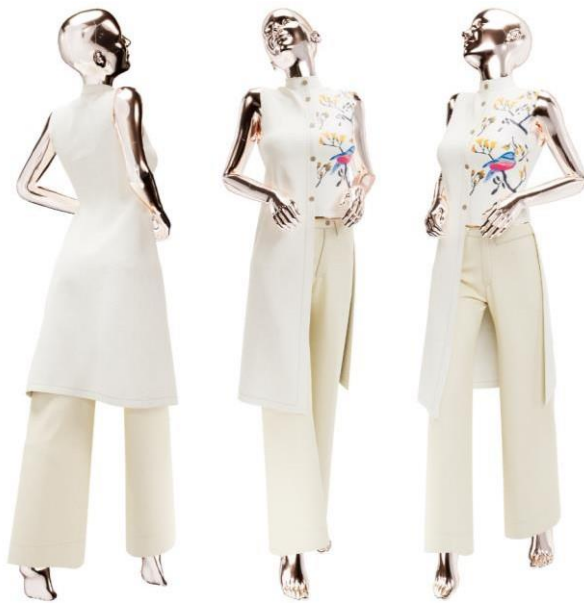
Figura 8 - Look em formato 3D produzido pela Hol studio