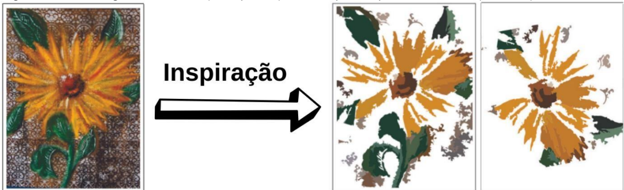
Figura 5 - Obra original da artesã (à esquerda) e estampas inspiradas na obra (à direita)