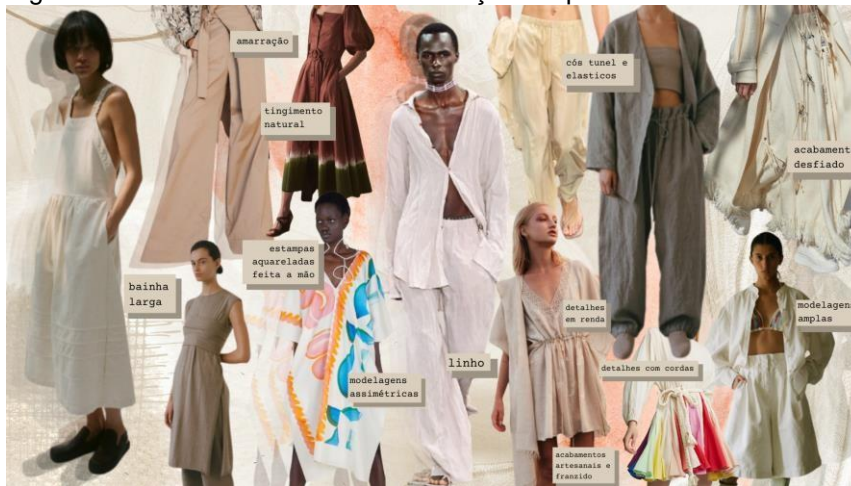
Figura 3 - Painel de Tendências da coleção “Alquimia”