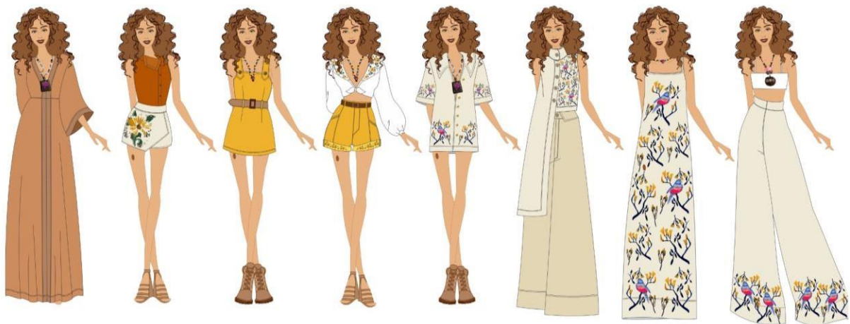
Figura 6 - Mapa da coleção