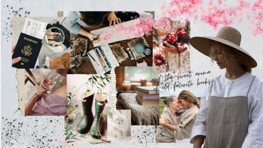
Figura 2 - Painel de Persona da coleção “Alquimia”