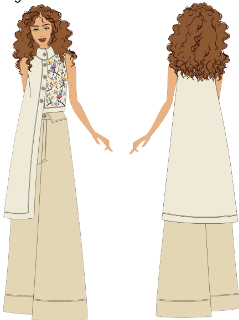
Figura 7 - Look selecionado