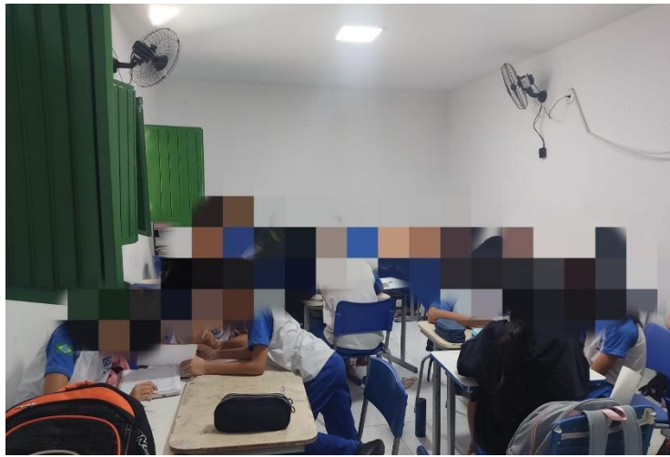
Figura 8: Foto dos alunos em grupo montando o roteiro do podcast.

Assim, além de treinar aspectos linguísticos, a atividade possibilitou o exercício da autonomia e da cooperação, promovendo a autoconfiança dos estudantes e contribuindo para o desenvolvimento da fluência e da consciência fonológica, fundamentais à aprendizagem significativa da língua inglesa.