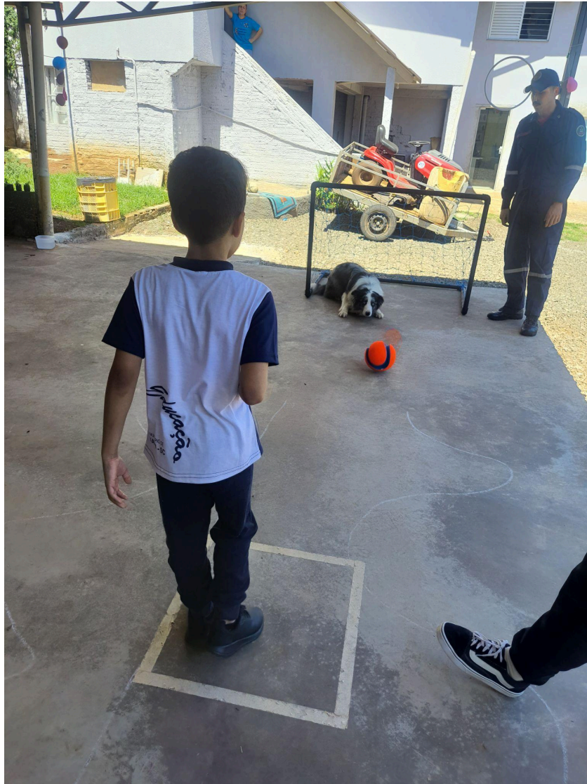
Figura 6: Projeto de Intervenções Assistidas em Xaxim, onde são realizadas atividades variadas de interação social e fisioterapêutica.