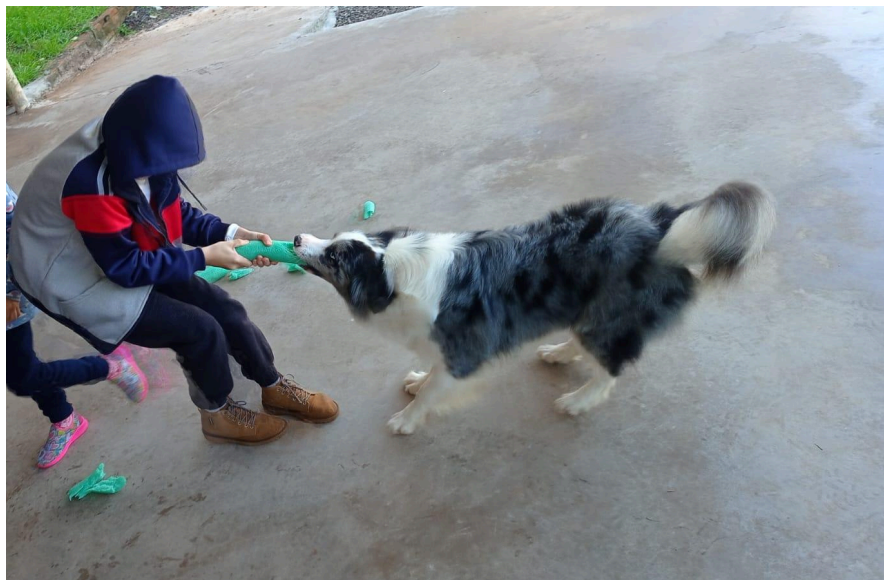
Figura 7: Projeto de Terapia Assistida realizada no Centro Especializado Teabraço, em Xaxim.

Em 2022, também ocorreu a primeira edição do curso de pós-graduação em Intervenções Assistidas por Animais, em parceria com o Instituto Federal de Santa Catarina.