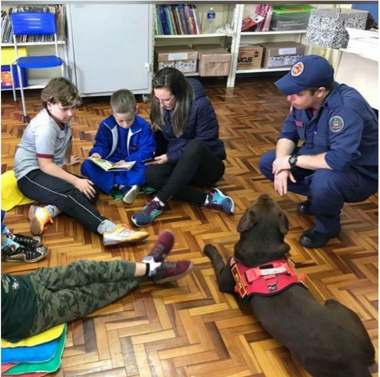
Figura 5: Projeto cão letrado, em Xanxerê.

Em 2019, o Iº Congresso Brasileiro de Intervenções Assistidas por Cães ocorreu em Xanxerê, promovido pelo Hospital Regional São Paulo e CBMSC.