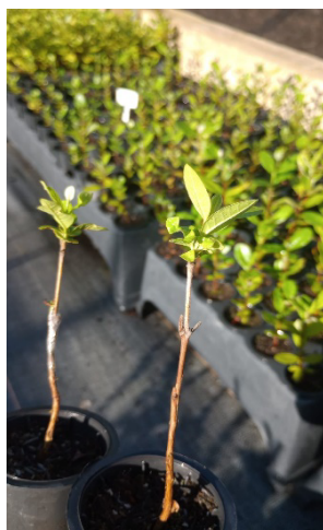
Figura 14. Teste de avaliação da técnica de enxertia (propagação vegetativa)

Atualmente não se recomenda a enxertia a campo durante o mês de setembro, utilizando material semi lenhoso (Ducroquet et al., 2008) devido ao baixo índice de pega obtido pelos agricultores (20 a 30%) dificulta a obtenção de estande uniforme de plantas. O mesmo foi comentado em uma palestra ocorrida no IFSC Campus Lages, no dia 15 de fevereiro de 2025 pelo Técnico agropecuário Humberto Santos Ribeiro da Estação Experimental de São Joaquim/Epagri.