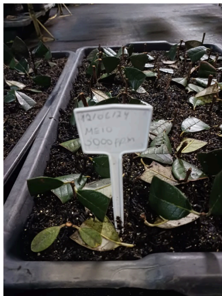
Figura 7. Experimento 2