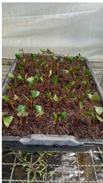
Figura 5. Montagem do experimento 1