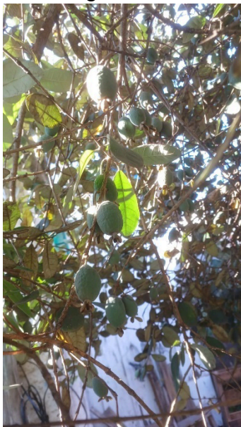
Figura 3. Frutos e folhas da goiabeira serrana ( Acca sellowiana )