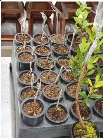
Figura 13. Teste de avaliação da técnica de enxertia (propagação vegetativa)

A produção de mudas clonais adequadas à formação de pomares homogêneos continua sendo um entrave para o cultivo da espécie uma vez que, até o momento, nenhuma técnica de propagação (enxertia, estaquia, micropropagação) tem apresentado resultados satisfatórios (Ducroquet et al., 2008).