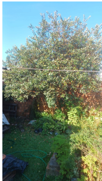
Figura 1. Planta de goiabeira serrana ( Acca sellowiana ).

A espécie apresenta como características botânicas principais um arbusto ou pequena árvore de dois a dez metros de altura, porém raramente ultrapassando os cinco metros, com ramos cilíndricos, acinzentados, glabros e lignificados (Figura 1). As folhas são opostas, curtas, pecioladas, pequenas e estreitas (Ducroquet e Ribeiro, 1991).