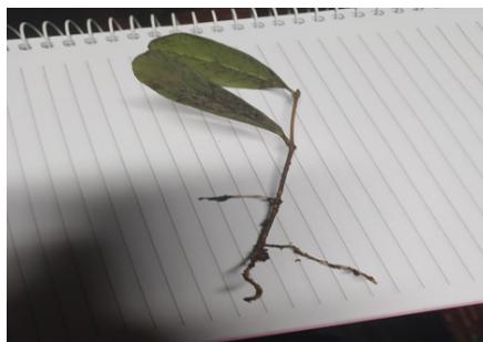
Figura 10. Muda de goiabeira serrana enraizada após 3 meses de plantio