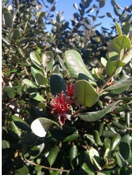
Figura 2. Flor da goiabeira serrana ( Acca sellowiana ).

púrpura é geralmente maior que os estames (Coradin, Siminski e Reis, 2011), de acordo com a figura 2.