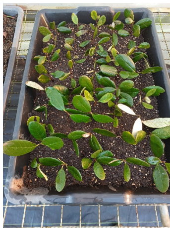
Figura 9. Montagem do experimento utilizando as estaquias com meristemas apicais

O experimento foi realizado com 100 estacas de ponta (apical, Figura 9), no qual não foram cortadas as pontas das folhas como diferença dos experimentos 1 e 2, sendo que estes foram divididos em duas bandejas, contendo 50 em cada bandeja, onde em uma bandeja foi acondicionada dentro de uma pequena estufa construída e outra fora desta, mas dentro da estufa do IFSC campus Lages.