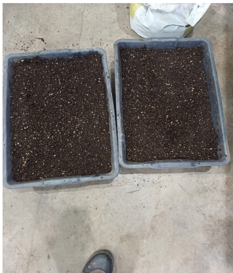
Figura 8. Bandejas com substrato para montagem dos experimentos