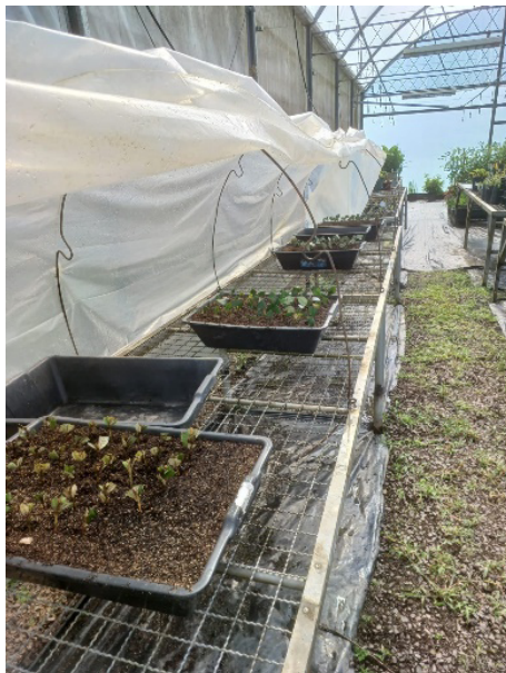
Figura 6. Experimento 2