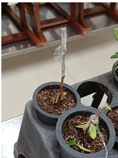
Figura 4. Técnica de enxertia (propagação vegetativa)

A rentabilidade do processo por miniestaquia para os viveiristas é viável pois todos os custos são repassados aos clientes, no caso, os produtores (Junqueira 2019).