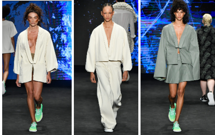
Figura 2: SPFW 2022 - TA Studios

Neste contexto, foi realizada uma análise do desfile da São Paulo Fashion Week de 2022, da marca TA Studios, que apresentou uma coleção com fortes inspirações na cultura do k-pop . Durante o desfile, foram observadas características estéticas das peças que remetem diretamente ao hanbok , como as modelagens amplas, gola dupla e amarrações assimétricas, revelando uma fusão entre tradição e contemporaneidade, conforme a figura 2.