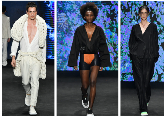
Figura 3: Roupas com fechamento em X

Como se pode observar na figura acima, a gola triangular e dupla no hanbok refere-se à gola do jeogori , uma característica distintiva do traje, que adiciona elegância e estilo à roupa. A figura 3 traz elementos do hanbok na forma do cruzamento frontal em X.