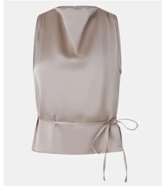
Figura 5 - Blusa da Renner com gola degagê e amarração

No mercado de moda brasileiro, essa tendência de aproximação com referências coreanas tem se manifestado não apenas em marcas conceituais, mas também no grande varejo. Um exemplo disso são coleções da Renner, onde é possível observar a presença de detalhes como as amarrações, inspiradas na estrutura do hanbok , conforme a figura 5. Segundo Cai (2020, apud Silva, 2023), esse tipo de acabamento faz parte da essência do traje tradicional coreano, que originalmente dispensava aviamentos como zíperes e botões. No lugar deles, eram utilizadas fitas, que além de possibilitarem ajustes de tamanho, mantinham as peças no lugar de maneira prática e simbólica, associada à estética e funcionalidade do vestuário tradicional.