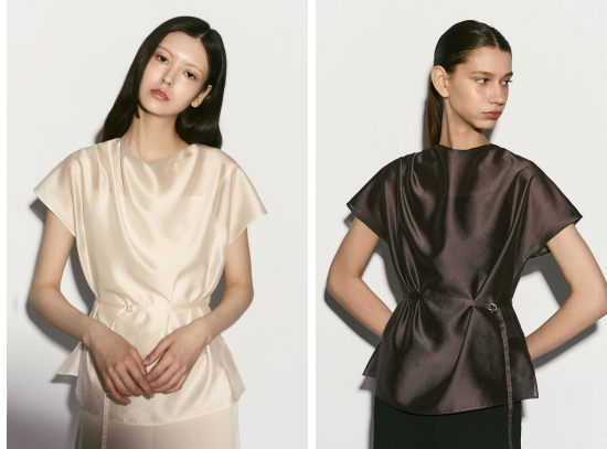
Figura 4: Blusa em cetim da RE'RHEE