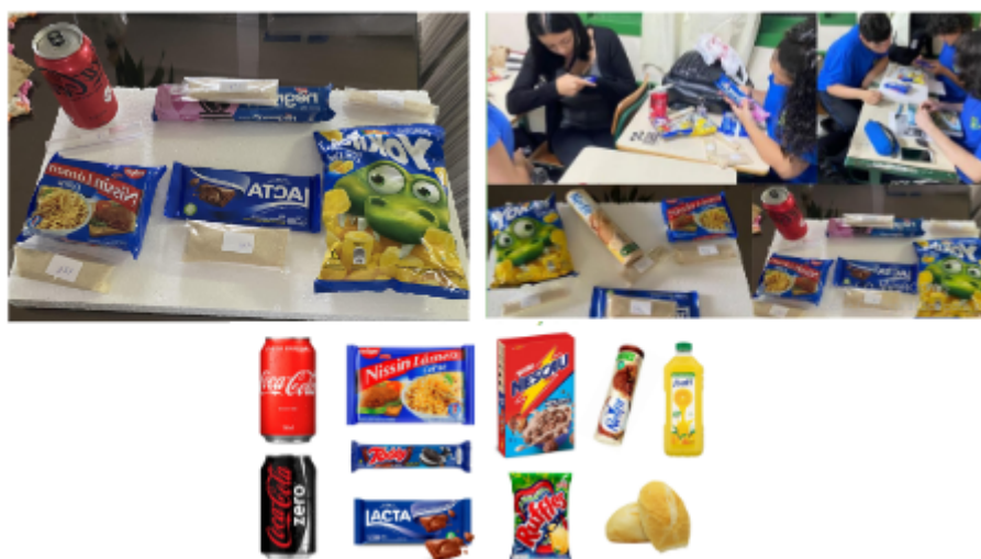
Figura 3: Análise de Rótulos

Para além do jogo com as jujubas, ao examinar os rótulos das embalagens, os estudantes foram desafiados a identificar e compreender os diferentes componentes químicos presentes na tabela nutricional, e as jujubas ajudaram na identificação dos açúcares, corantes e aromatizantes. Eles puderam analisar as estruturas moleculares e desenvolver em formato tridimensional esses compostos e discutir suas propriedades químicas, como mostra a Figura 3 .