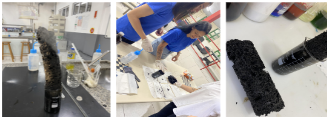
Figura 4: Experimento (Carvão em evidência).

desenvolvimento dos estudantes, revelou que o conjunto das atividades desenvolvidas contribuiu para o nível de aprendizado dos estudantes. Uma das atividades que permitiu chegar a essa conclusão, foi o experimento realizado com a turma de estudantes (Figura 4).