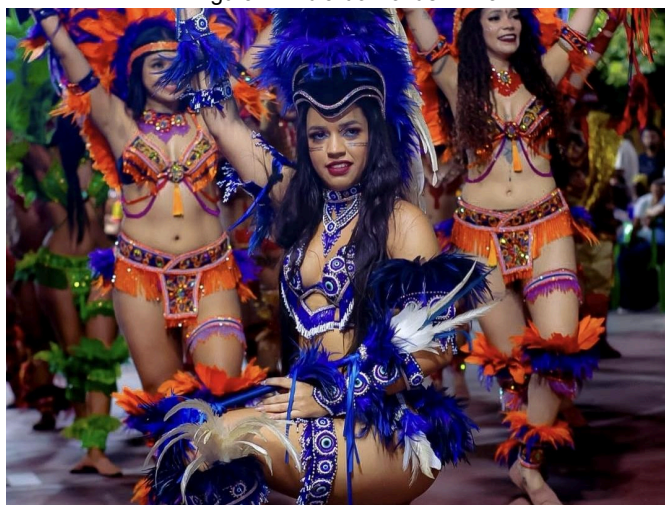
Figura 7: Índia do Boi de Axixá

conforme proposta por Bardin (2011), que a define como um conjunto de técnicas sistemáticas e objetivas voltadas à descrição e à inferência de significados presentes nas mensagens observando a figura 7.