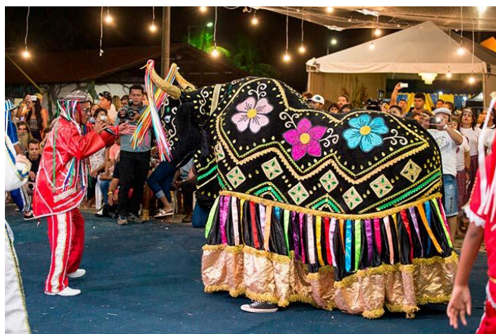
Figura 1: Bumba meu Boi

Conforme Rocha (2011, p.20), “o seu cenário histórico foi o universo social urdido pelas contradições oriundas da economia e costurado pela cultura política baseada no mandonismo local e no clientelismo, produzindo concepções, identidades, relações mútuas de ajuda, conflitos e laços territoriais entre os sujeitos envolvidos”. Silveira (2018) descreve o Bumba meu Boi como um auto popular religioso, com influências indígenas, ocidentais e africanas, o que representa as principais etnias formadoras do povo brasileiro. Sendo um relato popular que dramatiza a relação entre patrão e subordinados, assim como celebra a fé e devoção aos santos católicos como: São João, Santo Antônio e São Marçal.