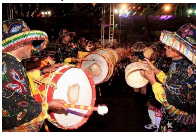
Figura 2: Zabumbeiros

Silveira (2018, pag. 21) caracteriza a zabumba como um grande tambor cilíndrico, que é revestido com couro de animal nas extremidades, sendo esticado por meio de um sistema de cordas”. O pandeirinho, que tem 20 cm de diâmetro, é feito com um pedaço da Jeniparana, uma pequena árvore nativa do Brasil. Tradicionalmente sendo coberto com couro de animais como o de boi, cotia, cabra ou veado.