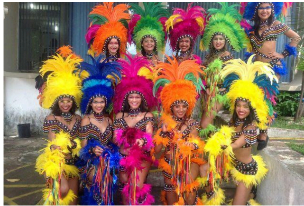
Figura 6: Índias do Boi de Axixá

O corpo permanece sendo o foco mesmo sob as penas, que integram e agem em conformidade com a forma dos membros femininos à mostra. A personagem Índia do Bumba meu Boi se destaca especialmente nos bois de orquestra, onde sua presença parece ter maior visibilidade e aceitação. Nesse contexto, as índias chamam a atenção por seus corpos esculturais, que seguem um padrão de beleza pré-estabelecido e são realçados pelas vestimentas. De modo geral, seu corpo deve apresentar cintura fina, quadris arredondados e pernas torneadas.