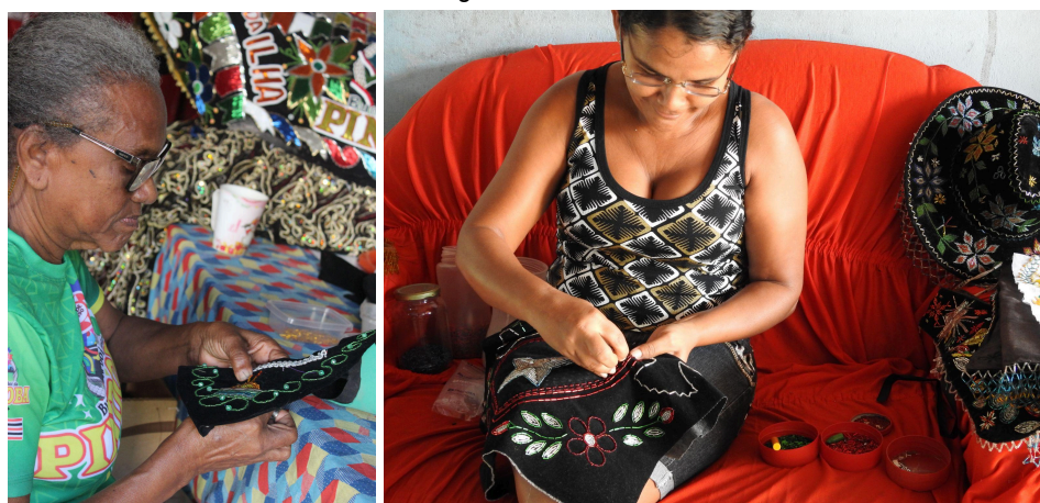
Figura 8: Artesãs

O Bumba meu Boi tem um forte vínculo com o artesanato, exigindo diversas habilidades e conhecimentos tradicionais para a produção dos bois, das indumentárias, dos chapéus, dos adereços e dos instrumentos musicais.