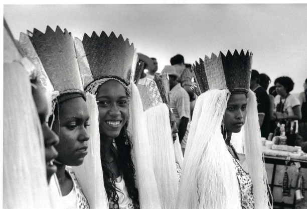
Figura 3: Índias Tapuias

Já as índias tapuias 6 Se diferenciam dos outros sotaques, sua indumentária é composta por uma coroa ou cocar , e possui fios de rafia sintética branca que acrescentam volume ao redor da cabeça, simulando cabelos. Sua indumentária é composta por um saiote vermelho e branco, padrão que sempre irá se repetir, uma blusa branca acompanhada por uma gola bordada com motivos florais e nas pernas meias de arrastão ou crochê com diferentes padrões, elas não usam penas como é de costume notar nas índias de outros grupos de Bumba meu Boi (Brandão 2016).