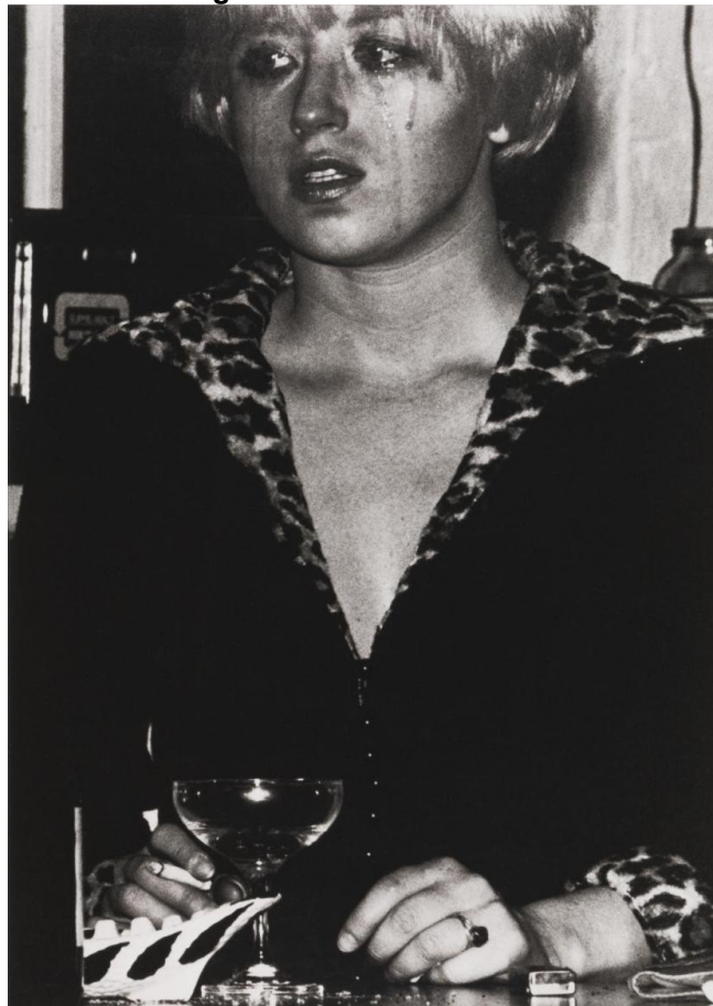
Figura 19 - Untitled Film Still #27

Na figura 19 (abaixo), há uma conjectura boemia resultante de uma decepção que transpassa o olhar distante da personagem.