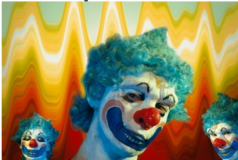
Figura 16 - Untitled #417