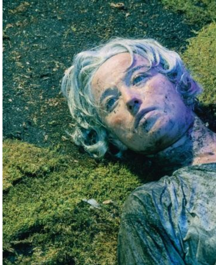
Figura 8 - Untitled #153