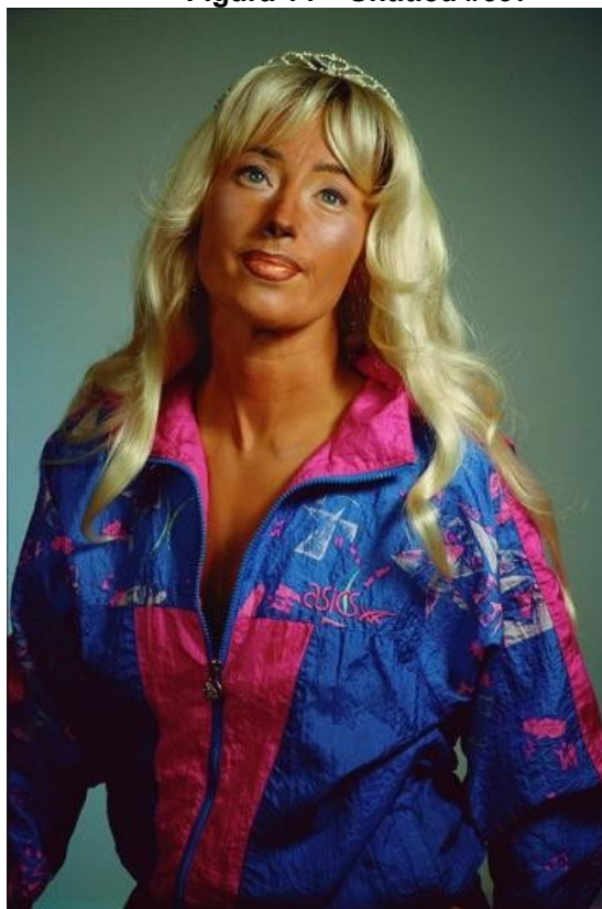
Figura 14 – Untitled #397