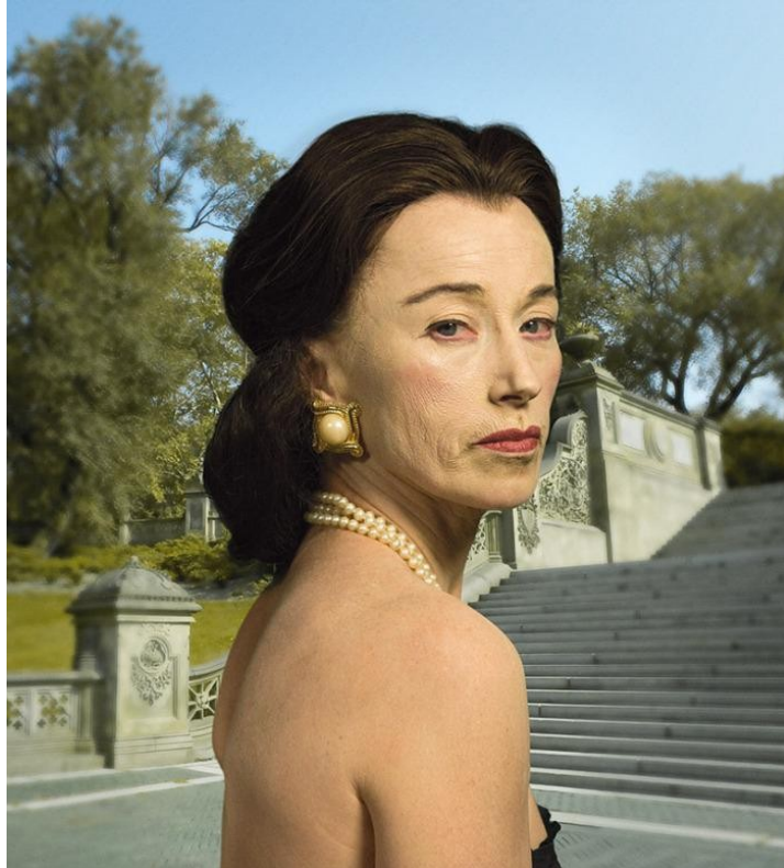
Figura 17 - Untitled #465