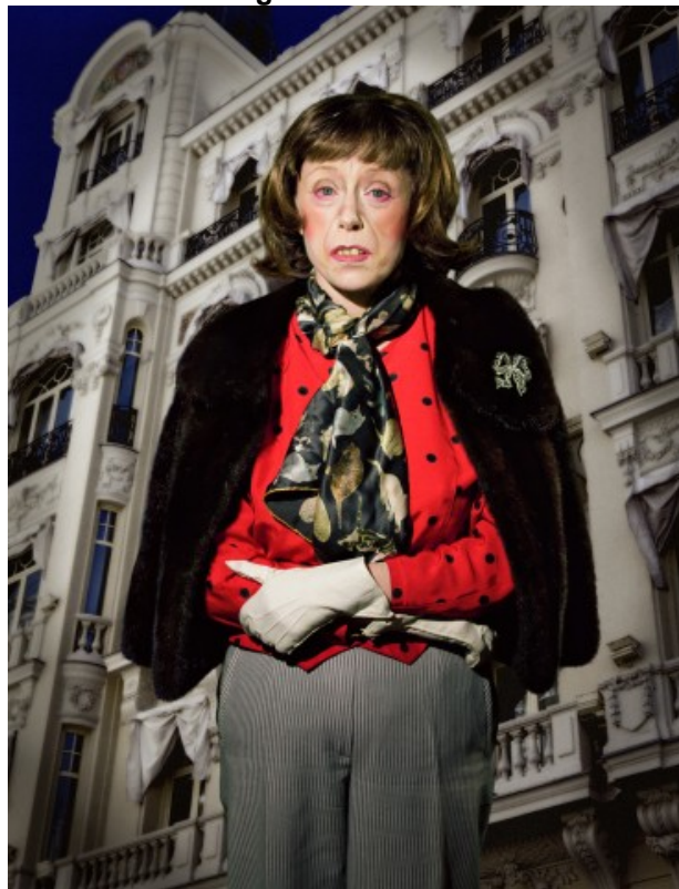
Figura 18 - Untitled #468