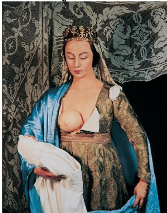
Figura 13 - Untitled #216