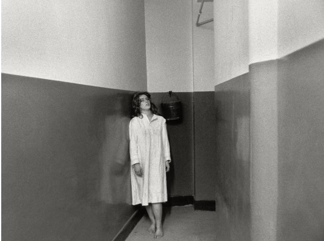
Figura 21 - Untitled Film Still #27b