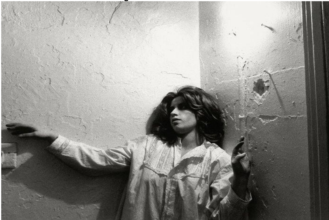
Figura 22 - Untitled Film Still #29