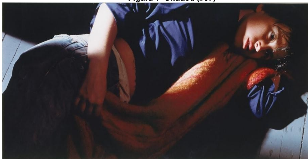
Figura 1- Untitled (#87)

Há uma pretensa divagação entre a imagem em uma relação paradoxal da angústia presente que pode ter sido gerada por algum trauma passado, e impede a personagem de expressar-se de modo eufórico, como se a história que ocorreu tivesse sugado todas as suas energias. O que pode ser interpretado pelo observador, como uma mulher que sofreu algum tipo de trauma, quiçá, vítima de violência doméstica. Ao observar essa trama, cabe ao observador se questionar: que sente essa mulher? A intensidade de sua expressão se condiciona em seu papel feminino ou ainda, como consequência disso? Quantas mulheres já foram percebidas nessa mesma condição, e o que eu como sujeito fiz a respeito?