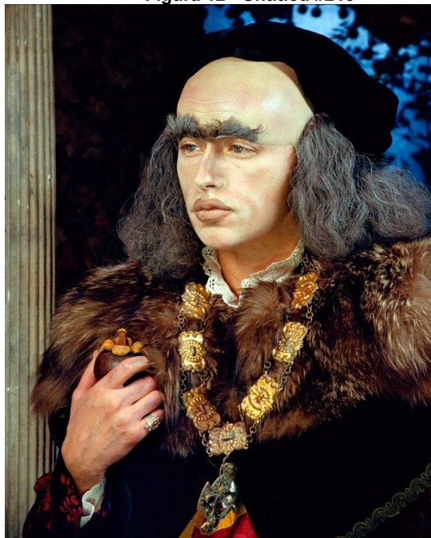
Figura 12 - Untitled #213