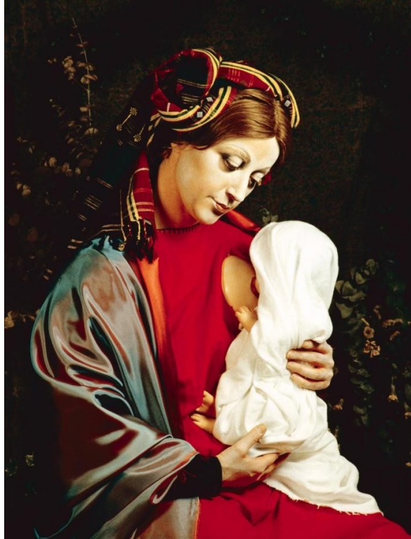
Figura 11 - Untitled #223