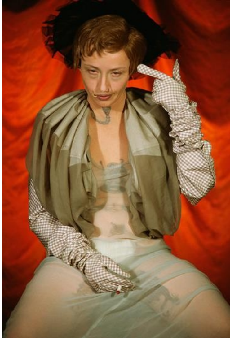
Figura 6 - Untitled #299