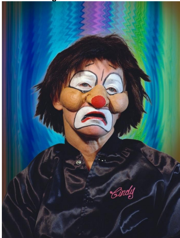
Figura 15 - Untitled #413

Segundo o Dicionário de Símbolos online (2021) 23 , “Ao mesmo tempo que o palhaço representa alegria, também representa o medo pelo fato de, muitas vezes, ser representado pelo Coringa que, com malícia esconde o seu temperamento atrás da sua irreverência”. Considerando que o palhaço possui uma função artística de distração e entretenimento, ainda há muitas interpretações que podem sugerir que Sherman transcende entre o papel de fotógrafa/artista, observadora e observada com o mesmo sentimento, expresso nessa série. Há uma fusão de expressões nos interlocutores dessa obra, novamente, incitando a contemplação da identidade dos sujeitos, mas numa mesma dimensão.