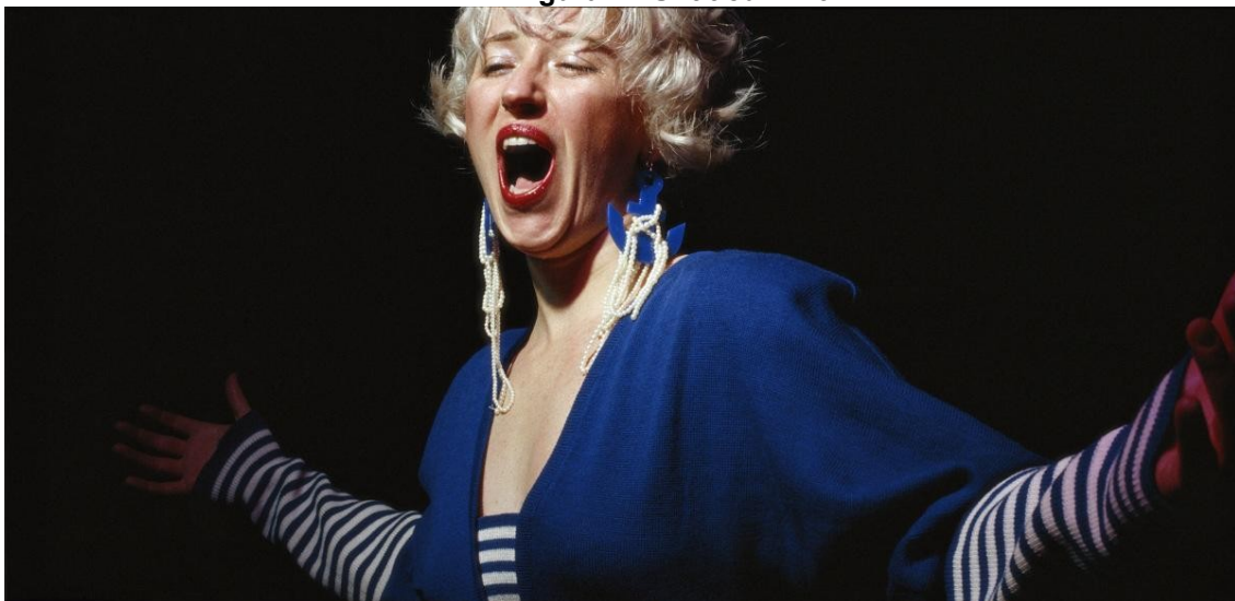
Figura 4 - Untitled #119

O que acontece ao sujeito feminino quando ela se impõe? Como é a postura e como é vista essa postura em uma condição conflitante? Quantos “monstros” internos e externos são enfrentados para que a autenticidade seja vivida, de fato? O que essas mulheres querem dizer, com seus jeitos, suas palavras, suas expressões? Há algo de ridículo na exuberância, ou nós fortalecemos conceitos equivocados de padrões comportamentais?