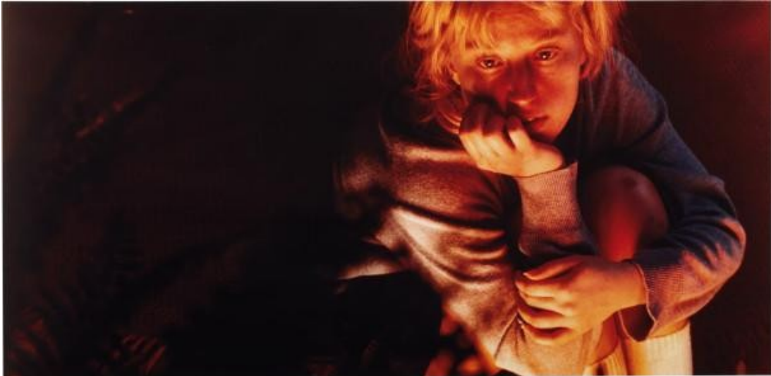
Figura 2 - Untitled (#88)