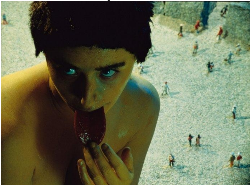
Figura 7 - Untitled #150

Na figura 7 (p. 17), a artista brinca com proporções. Entre possíveis interpretações, enquanto há um movimento cotidiano que perpassa pelo pano de fundo, com pessoas e atividades, há uma mescla de erotismo com inocência que prende o observador na tentativa de compreender a primeira imagem, da personagem próxima à câmera. Como esse corpo se identifica? Essa tendência de associar o erotismo e a inocência à figura feminina já não é também próprio do condicionamento do papel da mulher, da feminilidade?