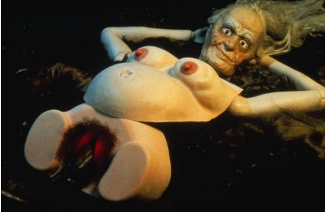
Figura 9 - Untitled #250