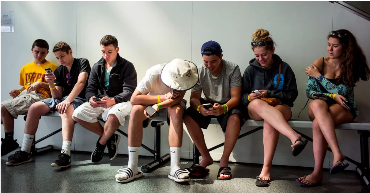
Figura 3.