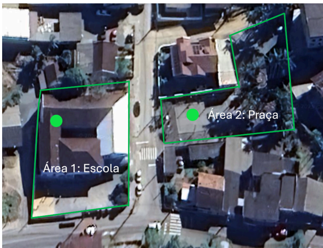
Figura 4 - Praça em frente à escola

Com 1.272 m 2 , o espaço abriga uma quadra, uma academia ao ar livre e um pequeno bosque (Figura 4).