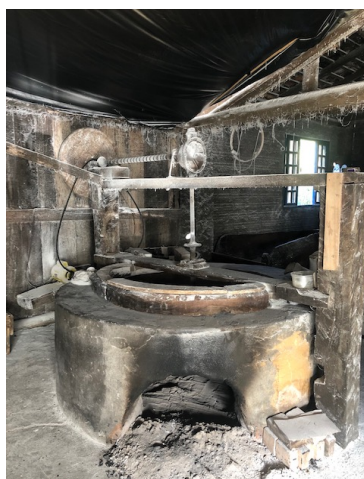
Figura 4- O forno