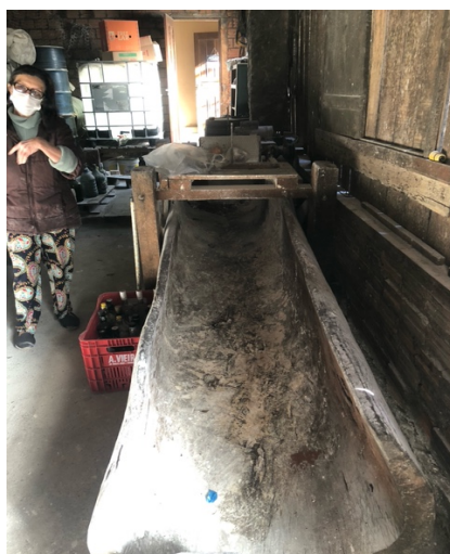
Figura 1- A prensa